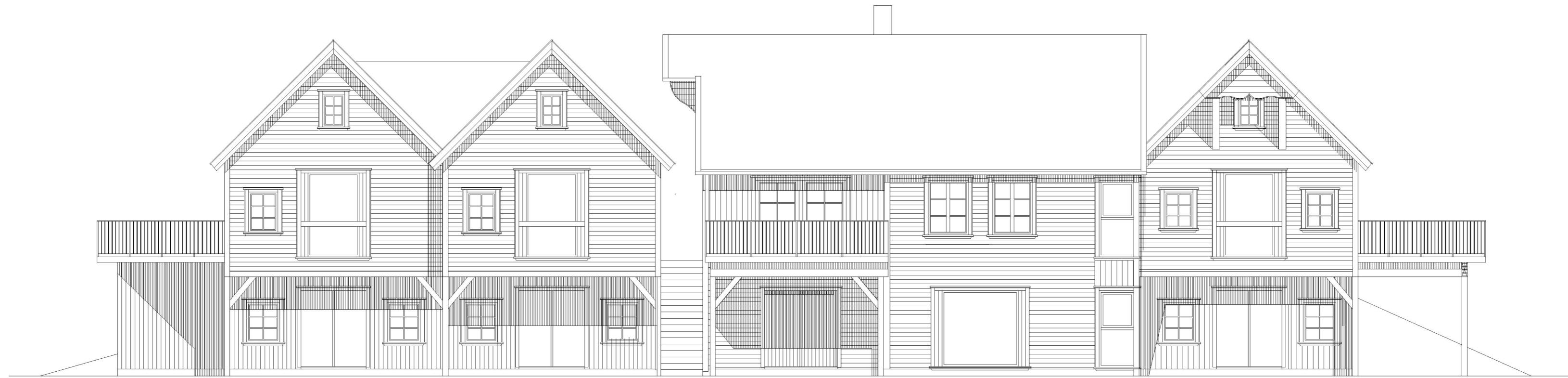
FASADE MOT NORD