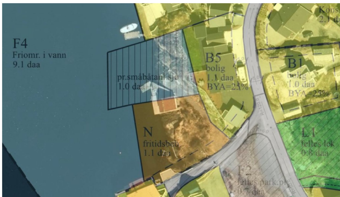
Figur 01 – eksisterende plan 467 over orto foto

Endring av privat småbåthavn til naust – gnr. bnr. 140/303.