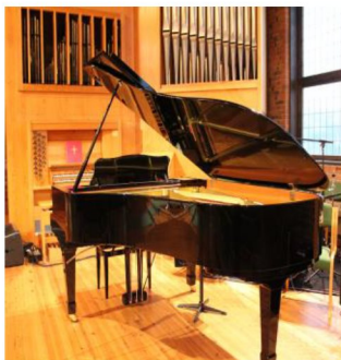
Hele flygelet ble finansiert av innsamlede midler og er mye i bruk.

I kirkerommet er det også et Yamaha C6 flygel (fra 1991/92), kjøpt brukt i 2018 for innsamlede gaver. Flygelet fikk en overhaling i forbindelse med kjøpet, har et stort fuktanlegg og er i god stand. Kjøpet av flygelet har gjort at de andre samlingsrommene i kirken har fått oppgradert til et hakk bedre piano, når 'klaverparken' har blitt forskjøvet.