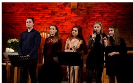
Sanggruppe på romjulskonsert 2018

Norheim kirke har god akustikk, godt lydanlegg og belysning, sentral beliggenhet og god plass til både utøvere og publikum. Vi ønsker å legge til rette for flere konserter, med både profesjonelle og amatører, både som arrangør og som utleier. Å dele raust på kirkerommet vårt til konserter, vil kunne løfte opp flere mennesker både i og utenfor menigheten gjennom musikalske opplevelser, i tillegg til å gi større tilknytning til kirken vår og bygge ned terskelen for å komme inn i det flotte kirkerommet vårt. Musikkutvalget vil kunne være en ressurs til å