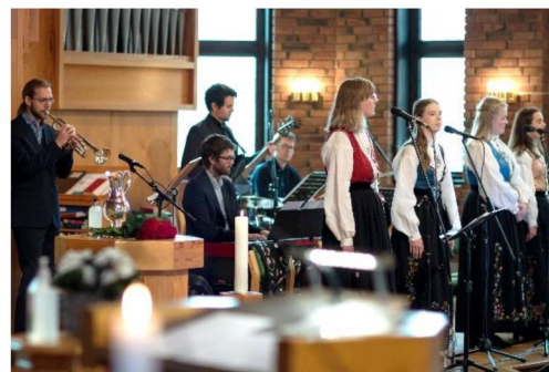
Totalt fire sangere og syv musikere deltok på konfirmasjonsgudstjenestene i 2020