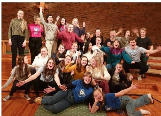
Nytt Liv-øvelse i 2020