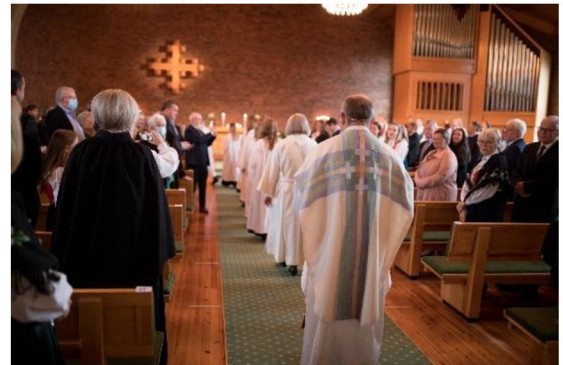
Konfirmasjonsgudstjenester 2020

Norheim menighet ønsker å inkludere lokalmiljøet og alle aldersgrupper i et rikt og variert gudstjenestearbeid. Derfor skal kirkemusikken inkludere ulike frivillige medarbeidere. Vi ønsker å fortsette å involvere barn, ungdom og voksne, instrumentalt og vokalt, i både musikalske innslag og i salmesang i gudstjenestene. Vi ønsker et variert uttrykk hvor både kirkemusikk og klassisk er like naturlig som rytmisk musikk, hvor bandinstrumenter, flygel, orgel, blåsere og strykere hører like mye hjemme. Et mål må være at alle som kommer til gudstjenestene kan bli møtt i musikken.