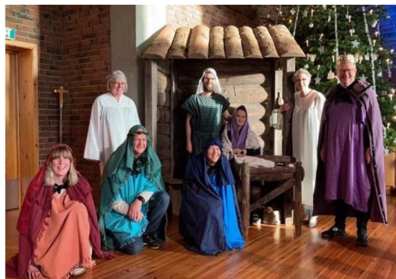
Rollebesetning adventsvandring 2020

Norheim menighet samarbeider med de lokale skolene og barnehagene, med hovedfokus på 1) barnehagevandring for de minste i advent og 2) julegudstjenester for hver av de fire skolene i ukene før jul. I tillegg jobbes det med tilbud for 1. trinn (kirkebygg), 4. trinn (bibelen), 5. trinn (dåp og nattverd) og 6. trinn (begravelse og kirkemusikk gjennom flere hundre år). Der hører kristen sang/musikk naturlig med. Det jobbes med å lage en salmeliste for skole og trosopplæringsarbeid for å skape gjenkjennelse i gudstjenestene for denne aldersgruppen.