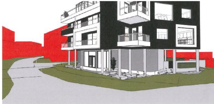
Perspektiv sett fra kryssa inn mot Hovedgaten