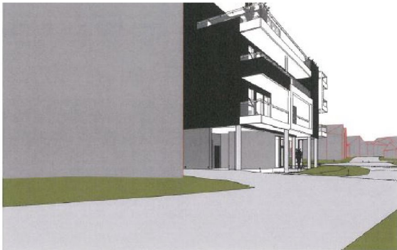
Perspektiv sett fra Hovedgaten

Slik saksbehandler ser det er dette ingen liten endring men noe som totalt endrer byggets estetikk mht plasseringen som hjørnebygg mellom Hovedgaten og Havengata- den avrundete formen med intrukket 1.etasje var et vesentlig poeng når bygget ble godkjent- jf perspektiv under: