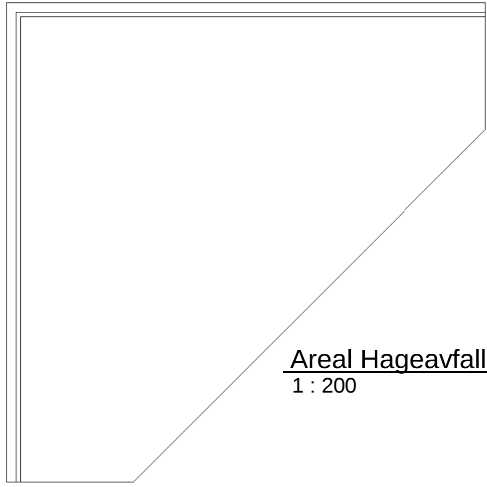
Areal Hageavfall 1 : 200

Innv. 200mm betongdekker hall 360m 2 Innv. 100mm betongdekker adm 108m 2