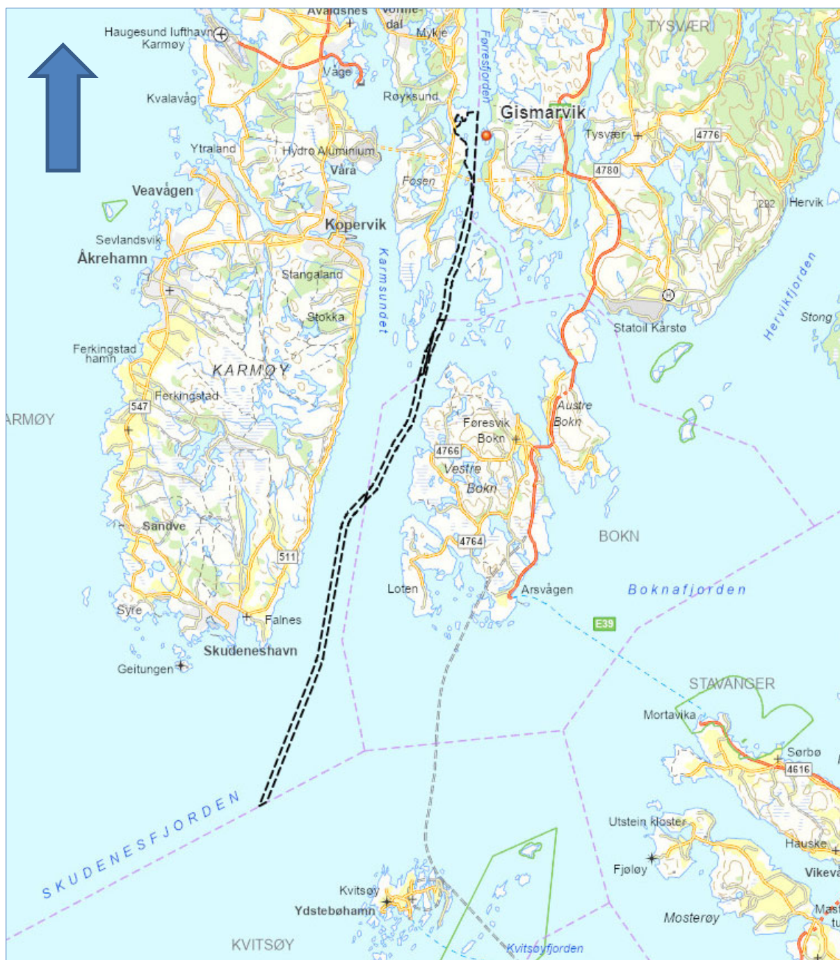
Figur 1: Forslag til plangrense til varsel om planoppstart.