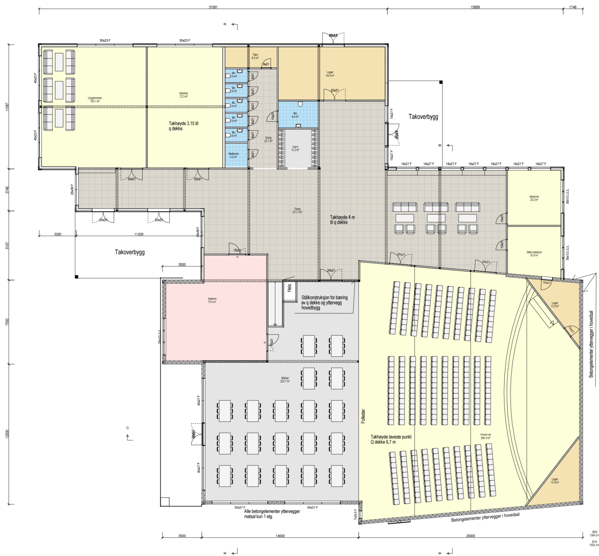
Plan 1 etg