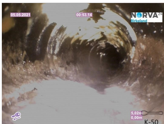
Spillvann_Inn til hus_Septik tank_20210505_143924.jpg

Dato for inspeksjonen 05.05.2021 Inspeksjonsnummer 3 Inspeksjonsretning Motstrøms