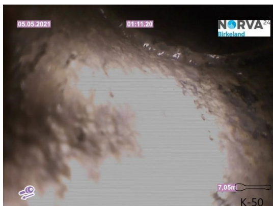
Spillvann_Inn til hus_Septik tank_20210505_143951.jpg