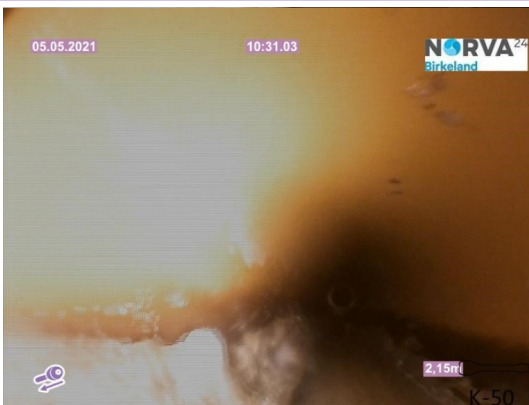
Spillvann_Inn til hus_Septik tank_20210505_143815.jpg