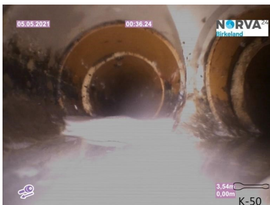
Spillvann_Inn til hus_Septik tank_20210505_143904.jpg