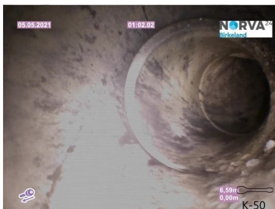
Spillvann_Inn til hus_Septik tank_20210505_143936.jpg