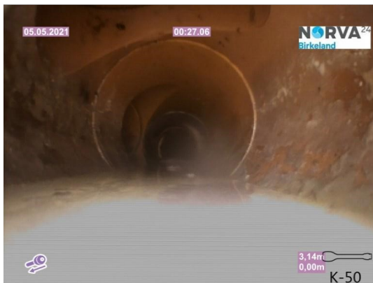
Spillvann_Inn til hus_Septik tank_20210505_143846.jpg

Dato for inspeksjonen 05.05.2021 Inspeksjonsnummer 3 Inspeksjonsretning Motstrøms