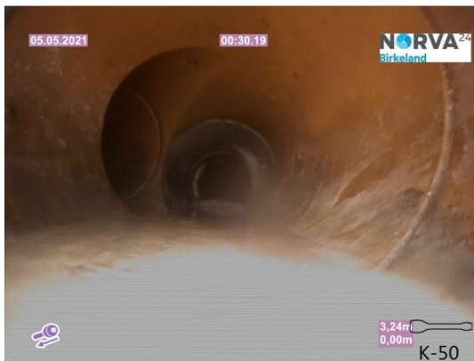
Spillvann_Inn til hus_Septik tank_20210505_143853.jpg