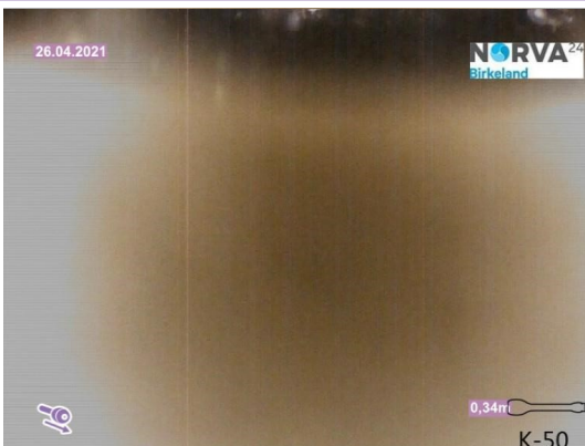
Spillvann_Stakeluke kjellar_Påkobling hovedledning_20210426_155829.jpg