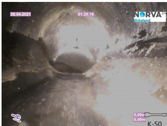
Spillvann_Stakeluke kjellar_Påkobling hovedledning_20210426_155954.jpg

Dato for inspeksjonen 26.04.2021 Inspeksjonsnummer 1 Inspeksjonsretning Medstrøms