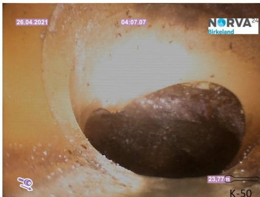
Spillvann_Stakeluke kjellar_Påkobling hovedledning_20210426_160248.jpg