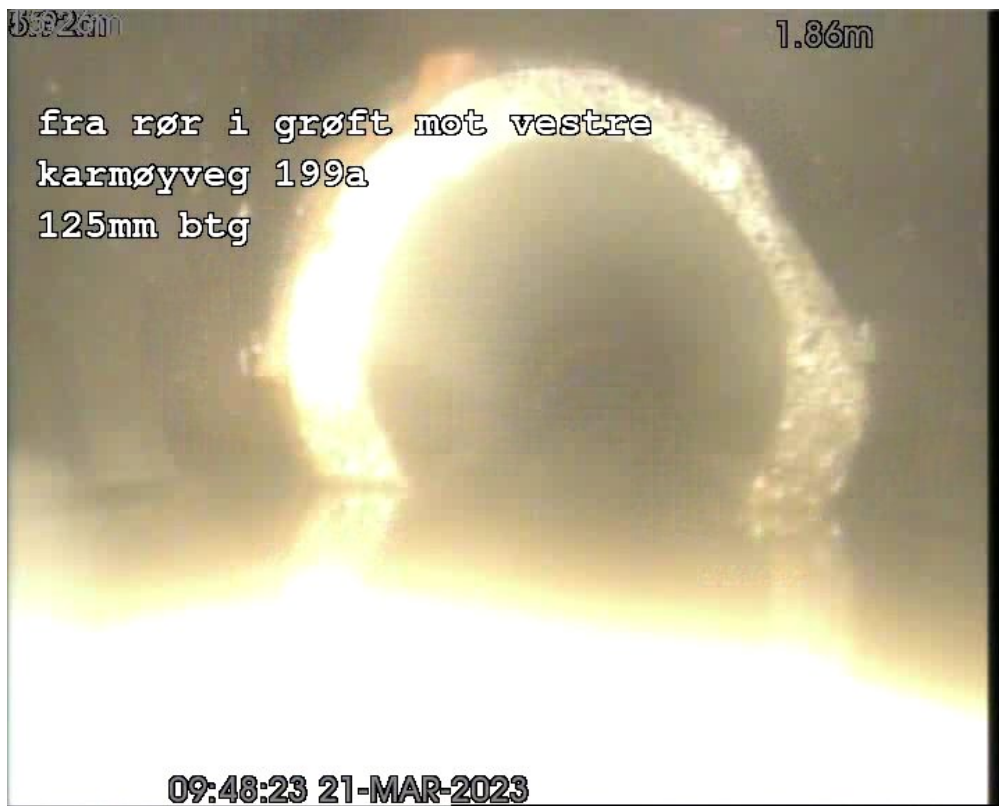
FS 1,90m Forskjøvet skjot, Gradering 3, Retning: Langsgående, Kl 12-12