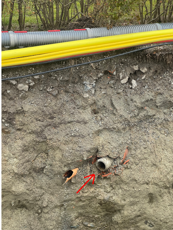
SI 0,00m Rør i grøft