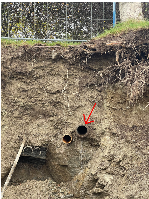
SI 0,00m Fra stikk i grøft mot vestre karmøyveg 229