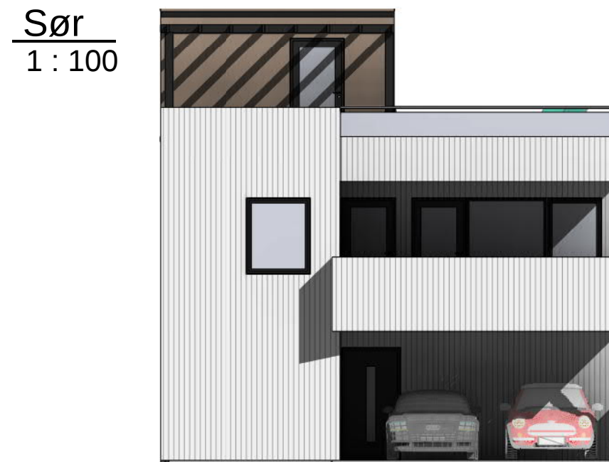
Sør 1 : 100