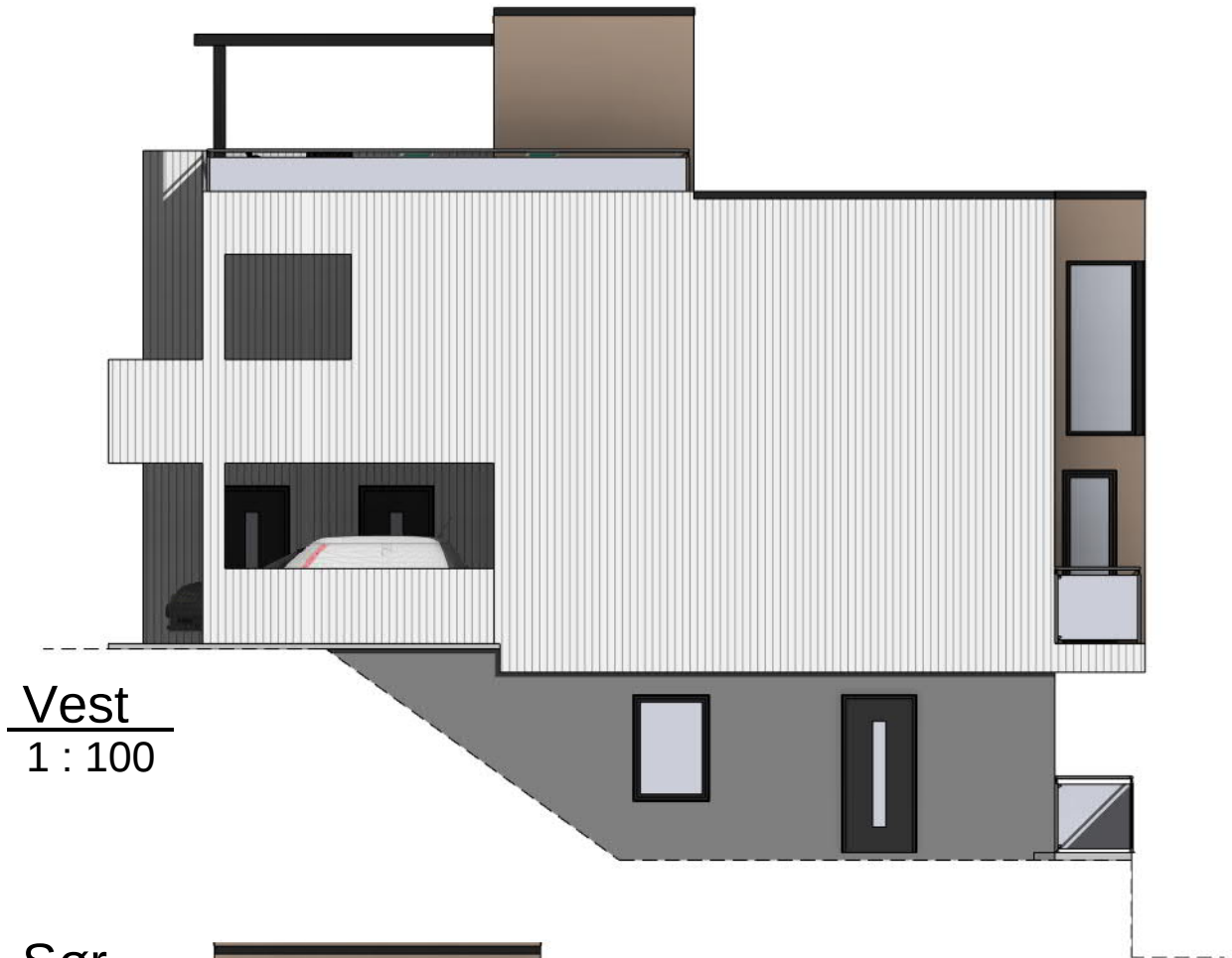
Vest 1 : 100