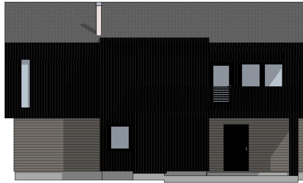
1:100 Fasade Vest