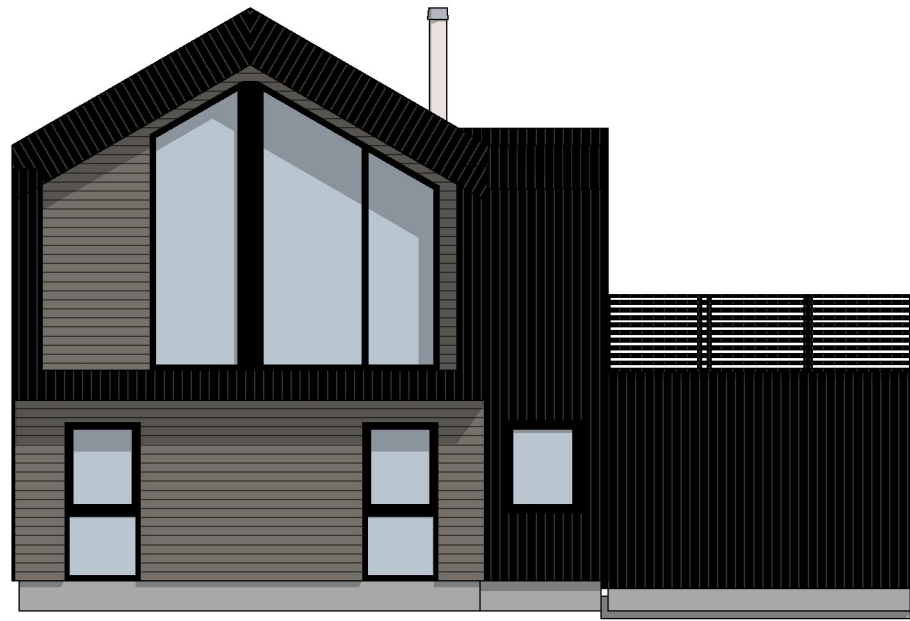
1:100 Fasade Nord