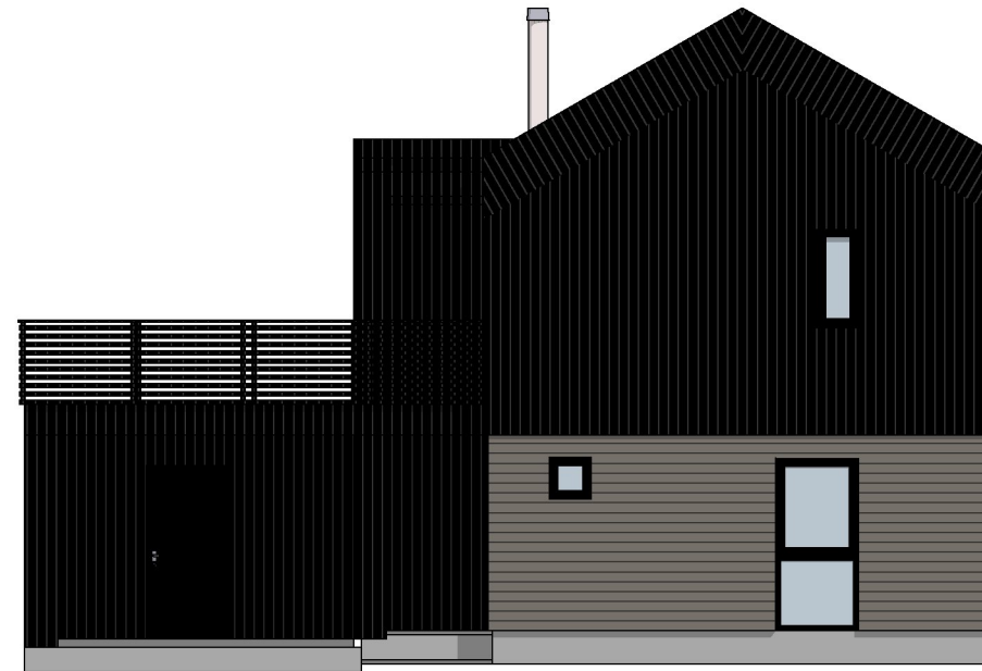
1:100 Fasade Sør