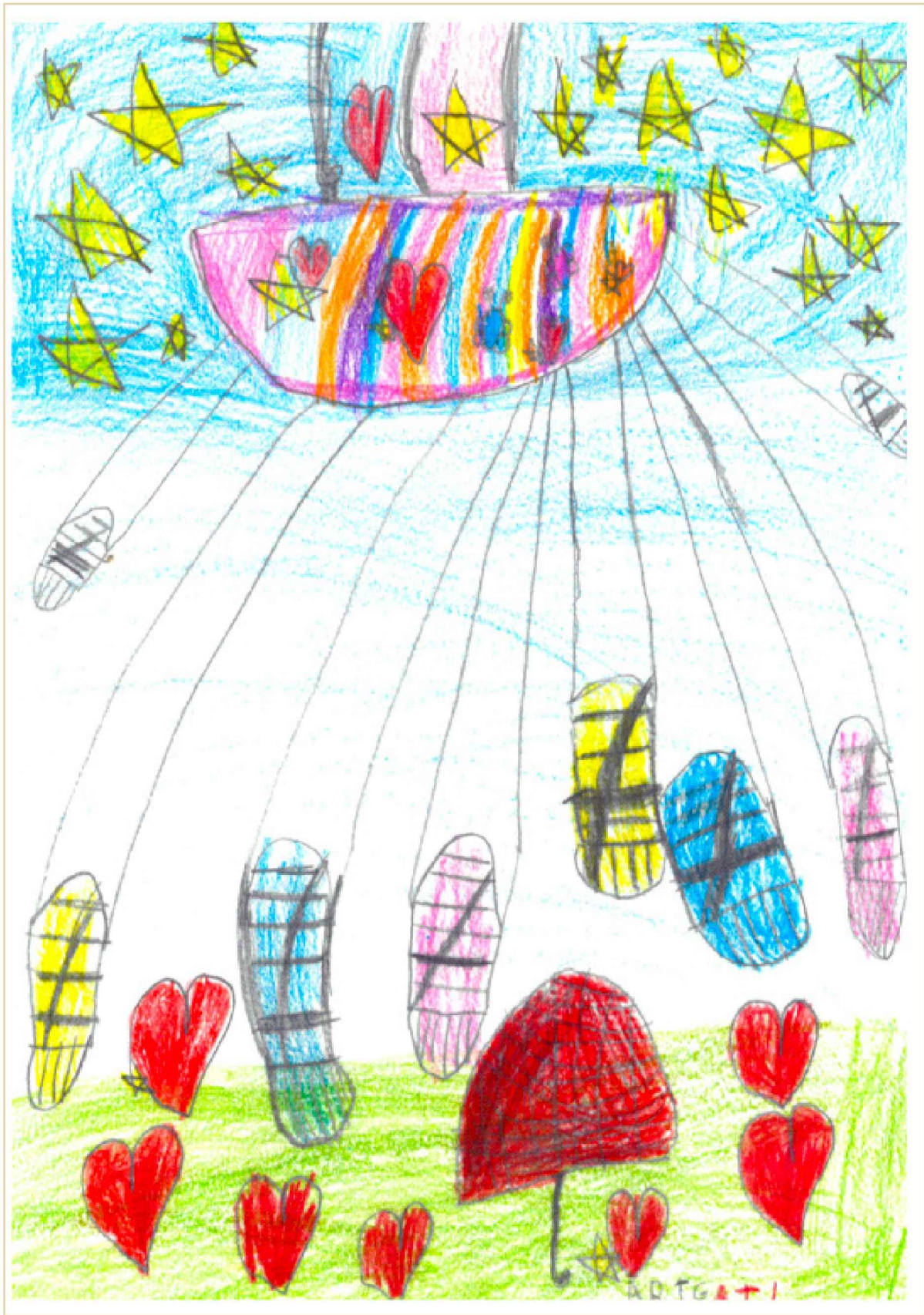
Illustrasjon: Drømmeskolegården min, 1. plass i tegnekonkurranse. Tegnet av Abigail, 1.klasse Kopervik skole