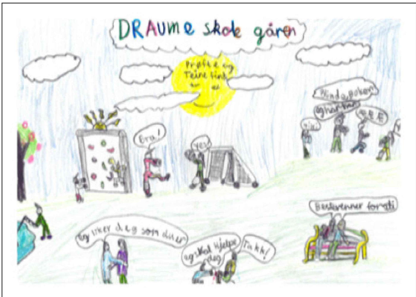
Illustrasjon: Drømmeskolegården min, delt 3. plass i tegnekonkurranse. Tegnet av Emily, 4.klasse.