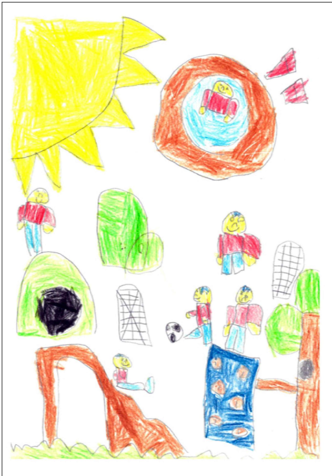
Illustrasjon: Drømmeskolegården min, 2. plass i tegnekonkurranse. Tegnet av Falk, 2.klasse.