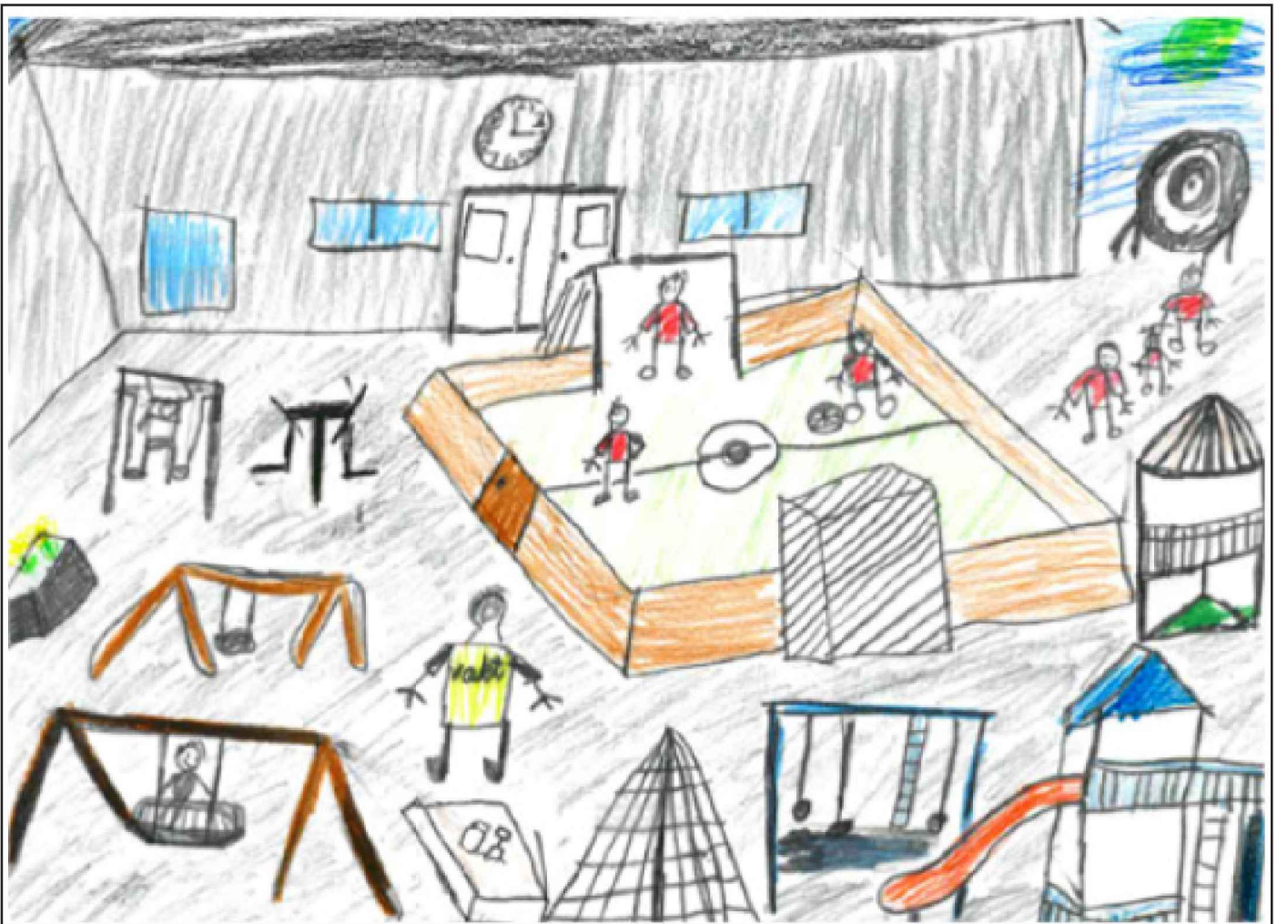
Illustrasjon: Drømmeskolegården min, delt 3. plass i tegnekonkurranse. Tegnet av Sindre, 4.klasse.