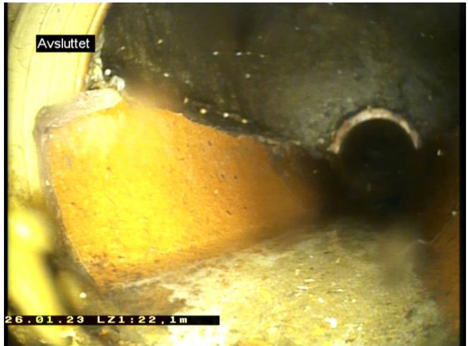
Foto 007 Video 00.04.00 Fjerning 22,10 m Avsluttet

Dato 26.01.2023 Opptak 144-4 Bøvegen 5, 150mm betong