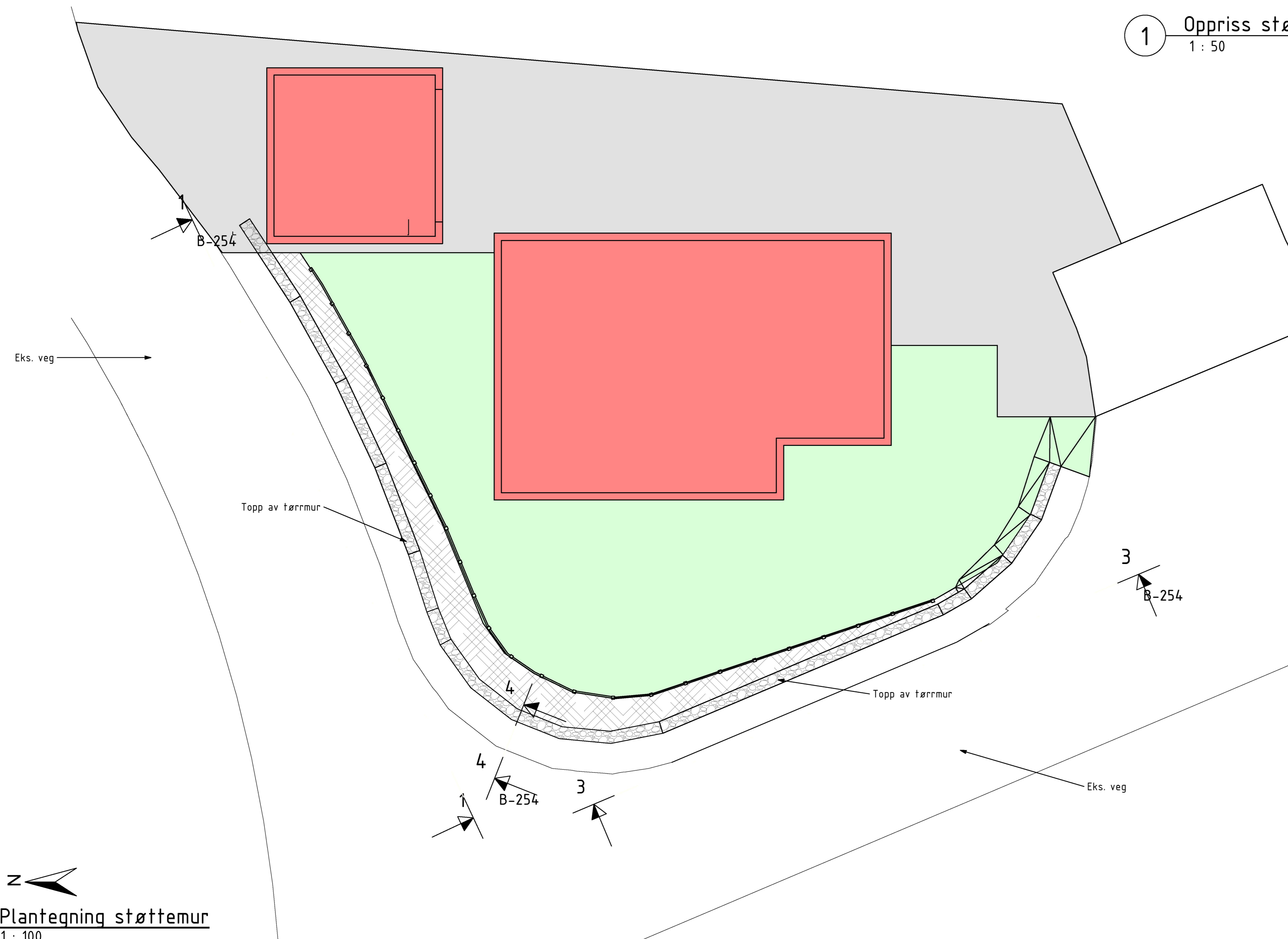
Plantegning støttemur 1 : 100