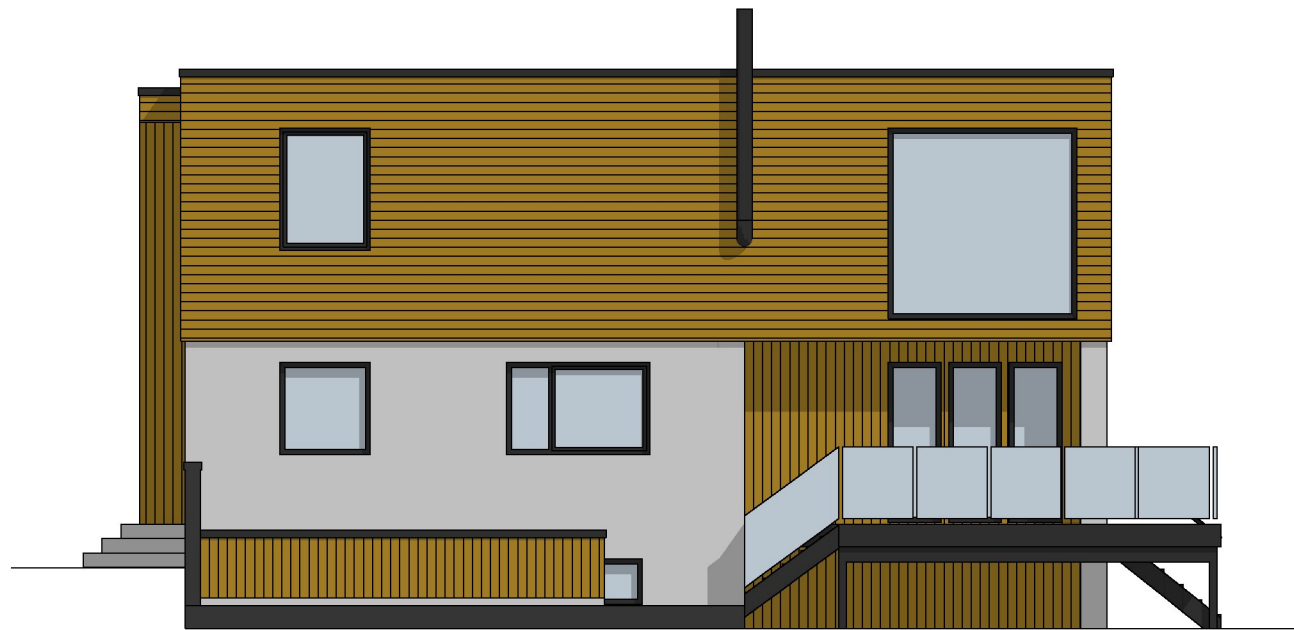
FASADE MOT NORD