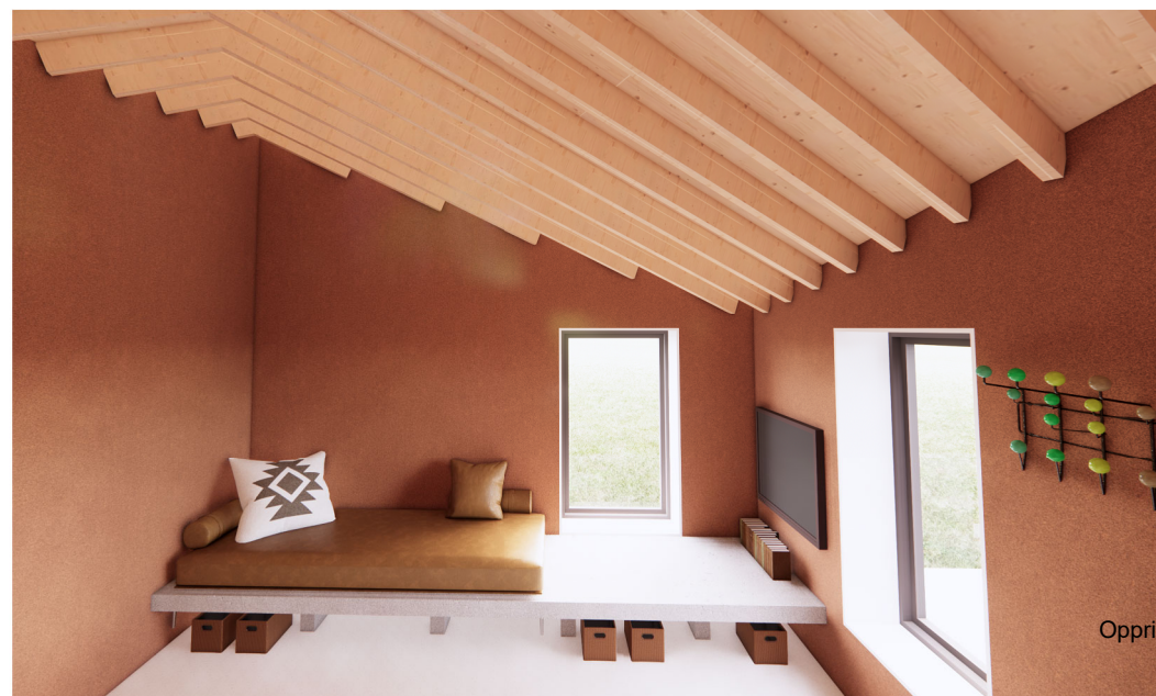
Illustrasjon, materialitet i boligen stemmer ikke