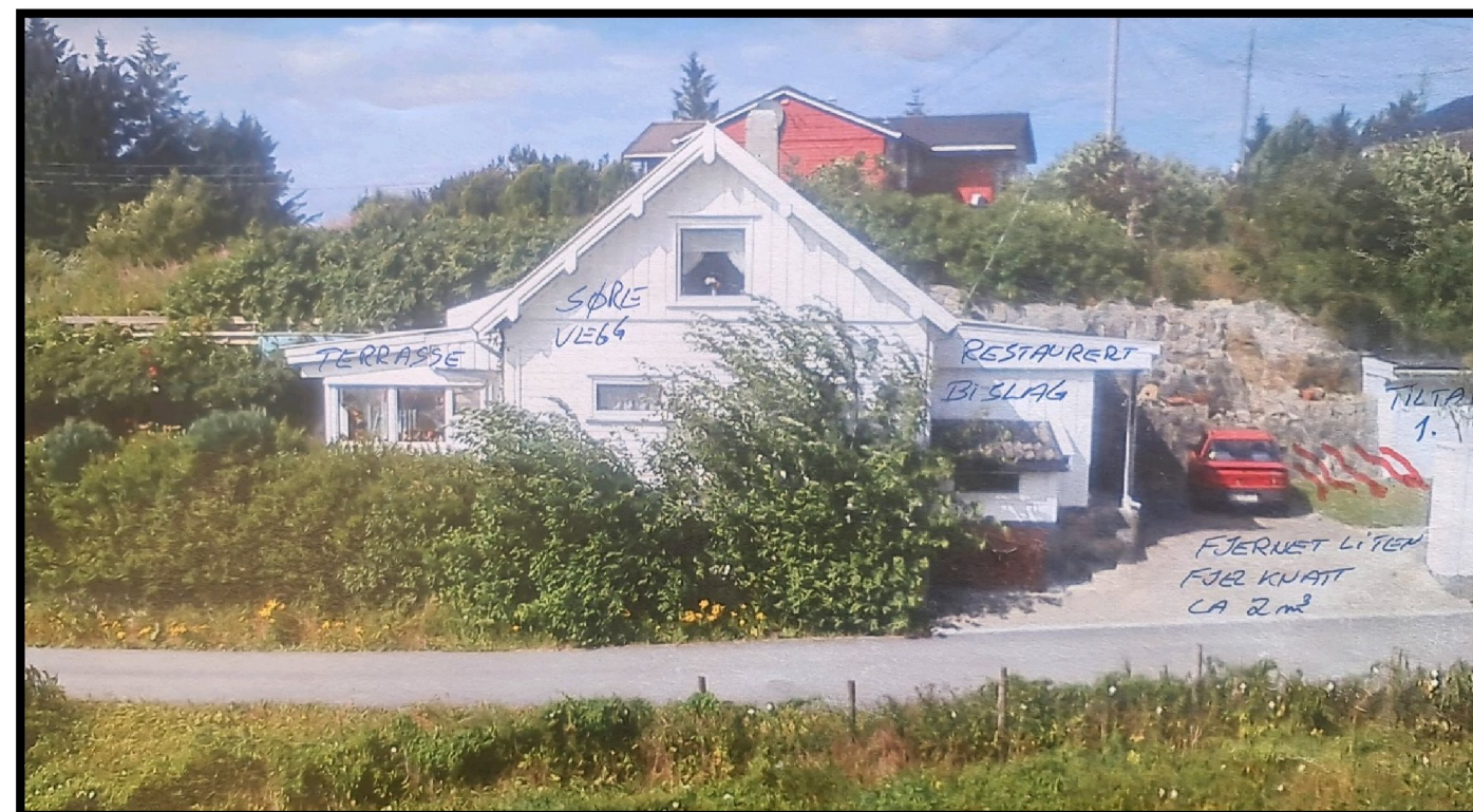
Figur 2 – Fassade mot sør, Etter kontroll fant vi at nevnte fjellknutt utgjorde ca. 1 m 3