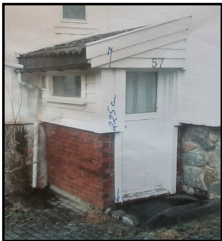
Figur 3 – Punkt 1 - Overbygget kjellertrapp