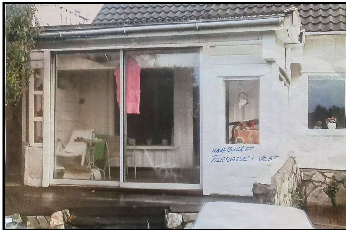
Figur 5 – Punkt 3 og 4 – Utrykket vegg i stuen og innbygget terrasse i vest (Vinterstue)