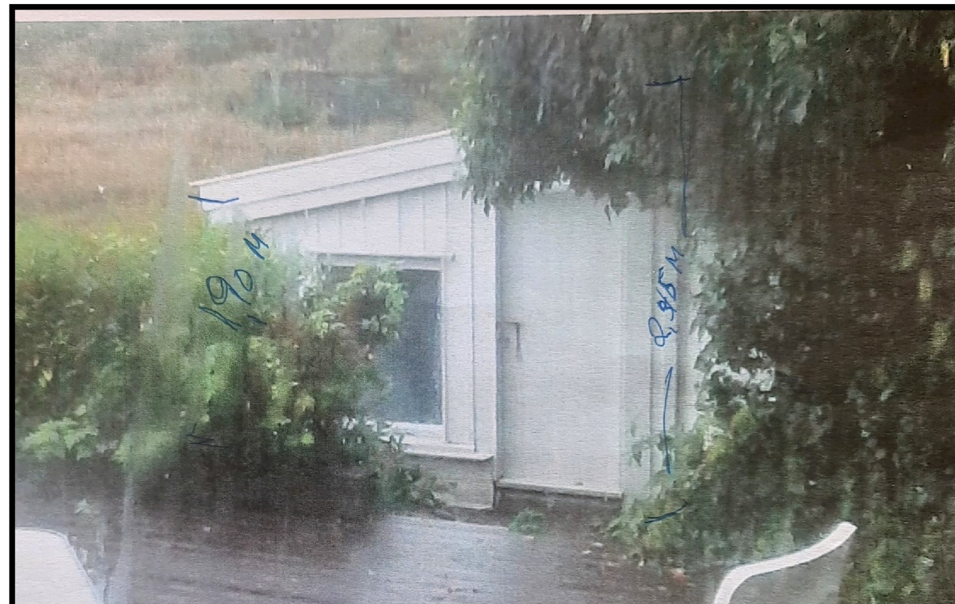
Figur 6 – Punkt 5 – Redskapsbod mot vest