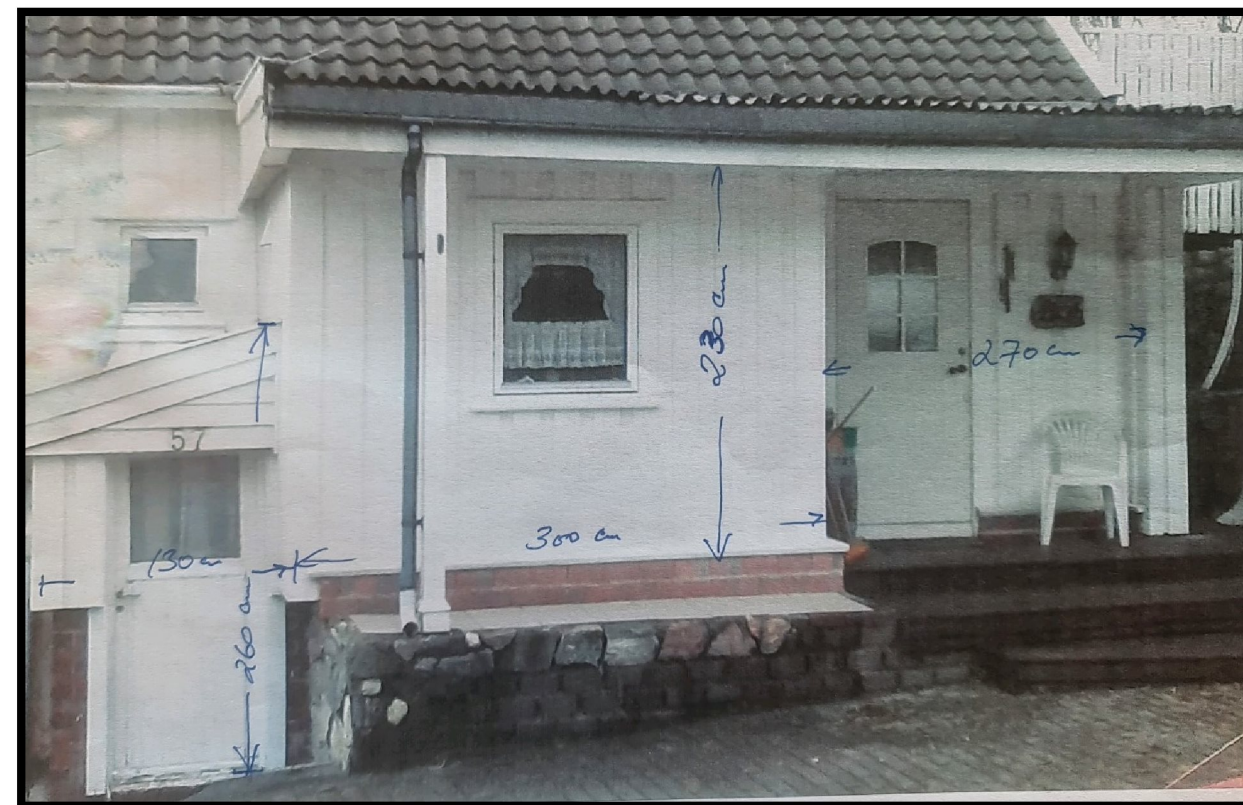
Figur 4 – Punkt 2 – Ombygget bislag/gang