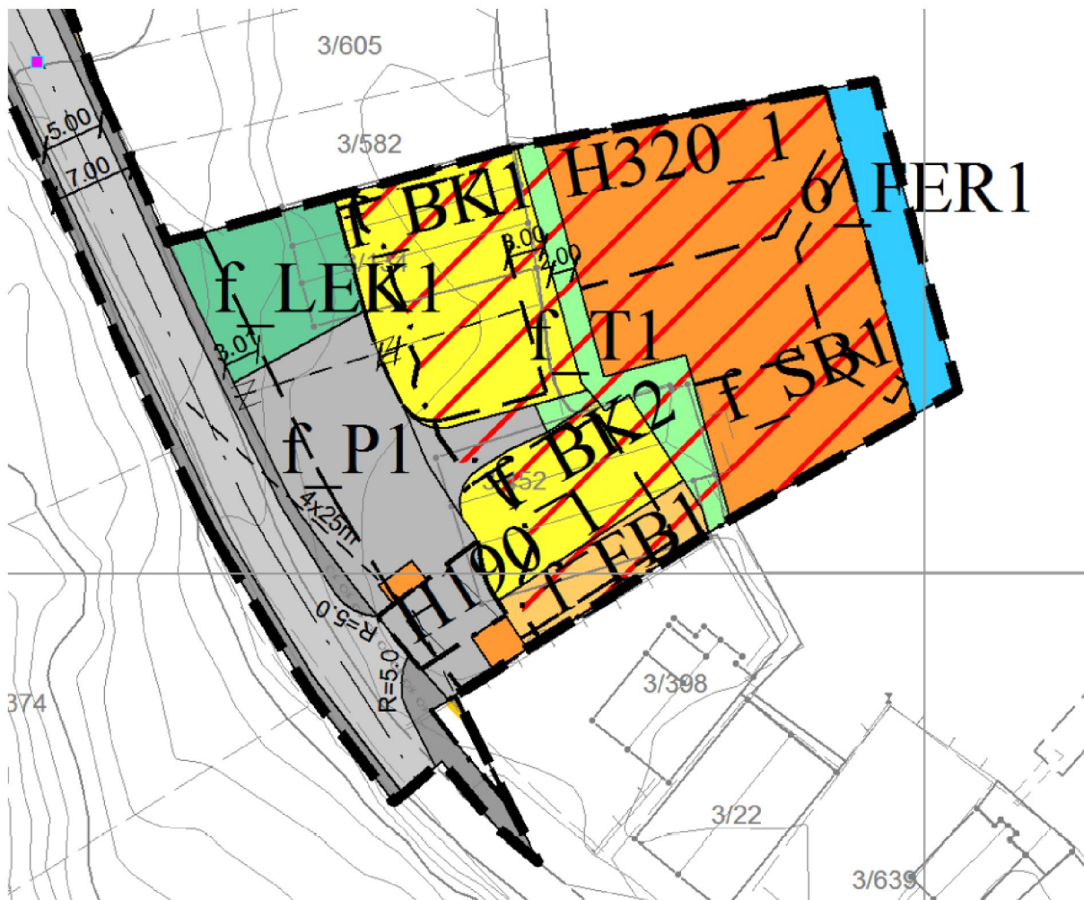
Illustrasjon over viser originalt plankart vedtatt 19.10.20

Følgende bestemmelser er det gjort endringer på: