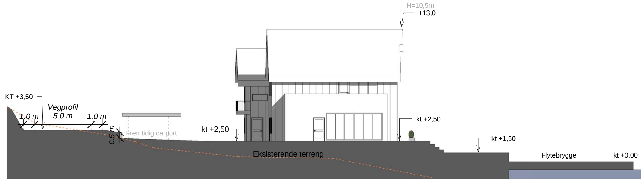
1 Fasadesnitt A 1 : 200