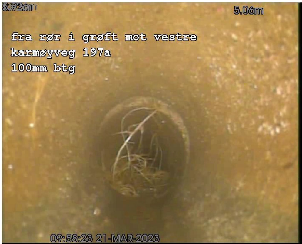
RØ 5,10m Røtter, Gradering 3, Type: Sammenfiltrede røtter, Kl 5-9