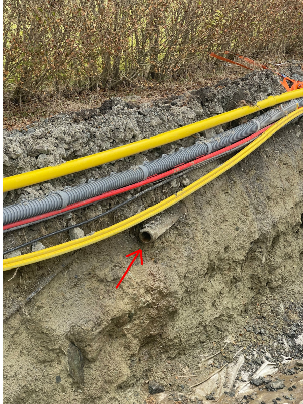
SI 0,00m Rør i grøft