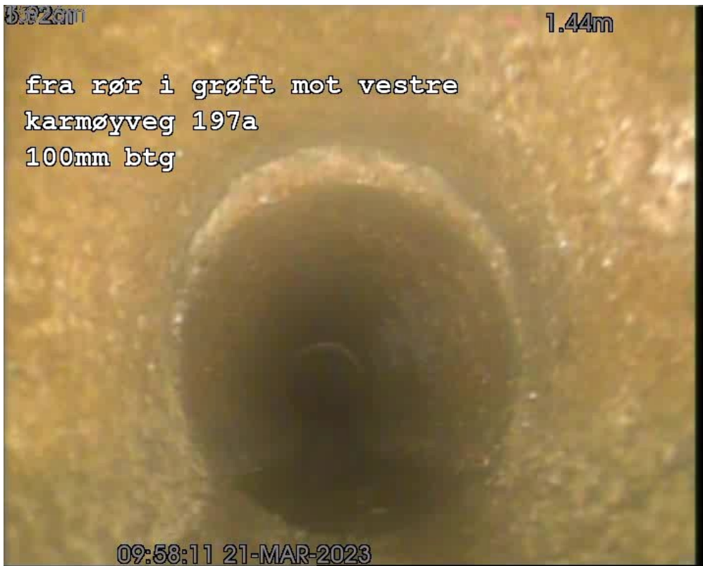
FS 1,40m Forskjøvet skjøt, Gradering 2, Retning: Langsgående, Kl 12-12