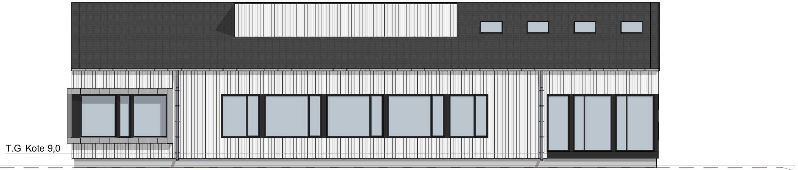
1:100 Fasade Nordøst