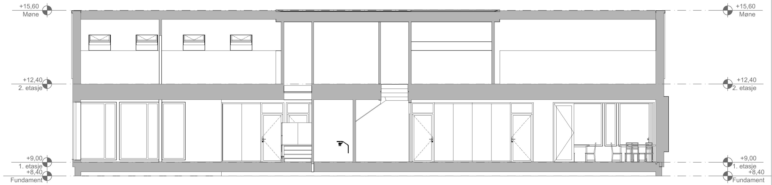
1:100 Snitt B