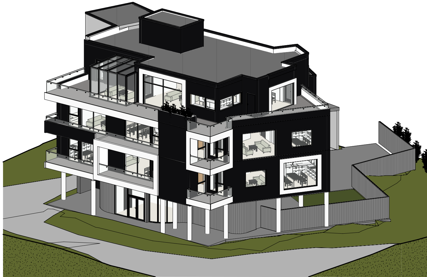
3D view 1