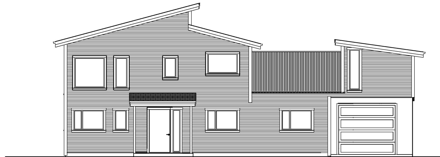
Fasade mot Nord / Vest