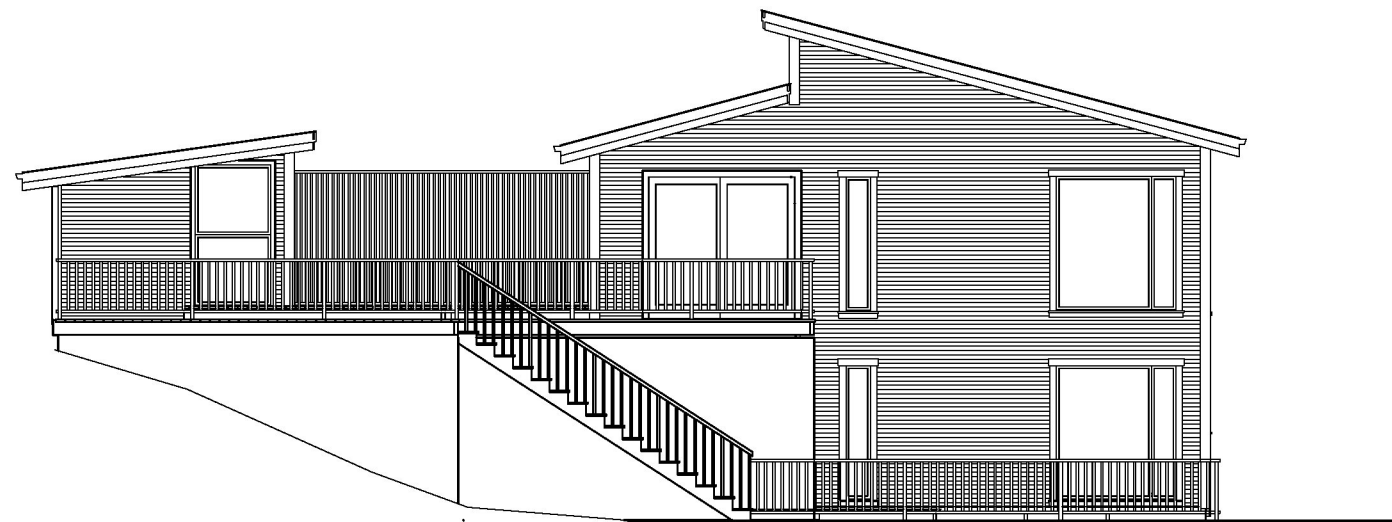
Fasade mot Sør / Øst