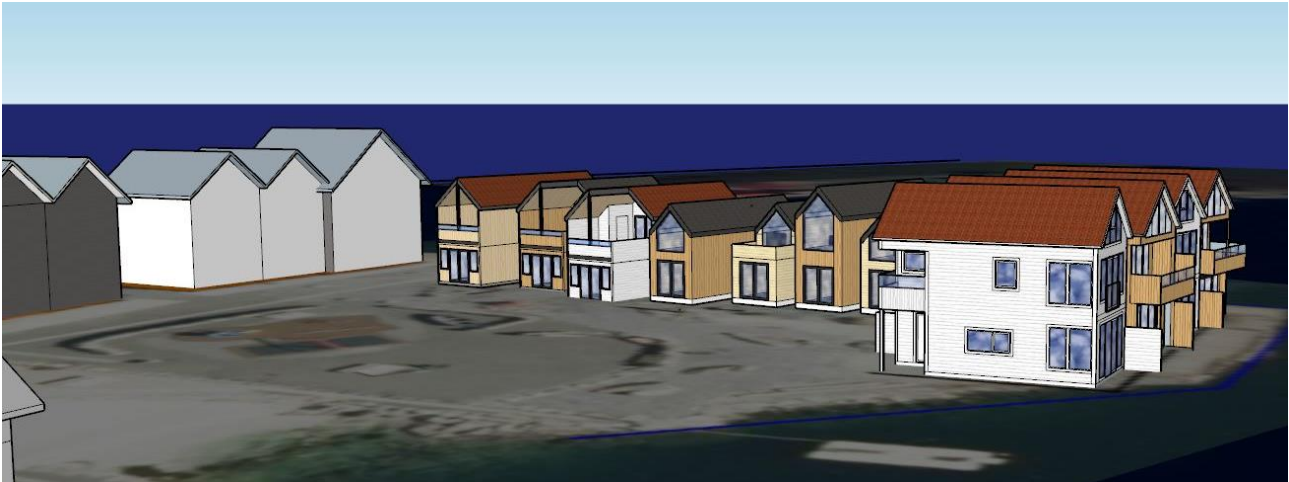
Fig 3: Illustrasjon av tenkt utbygging av formålene FB2/F1 og FB3/F2 med frittliggende fritidsbebyggelse. To av de fire bygningene til høyre er allerede bygt.

Planforslaget er vurdert til ikke å utløse krav om konsekvensutredning med planprogram i samsvar med PBL § 4-1 og 12-9. Endringen ville kunne gjennomføres som en mindre endring, i samsvar med referat fra oppstartsmøtet den 03.03.2023.