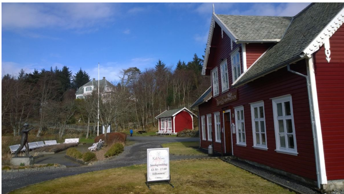
Det gamle administrasjonsbygget fra 1869.