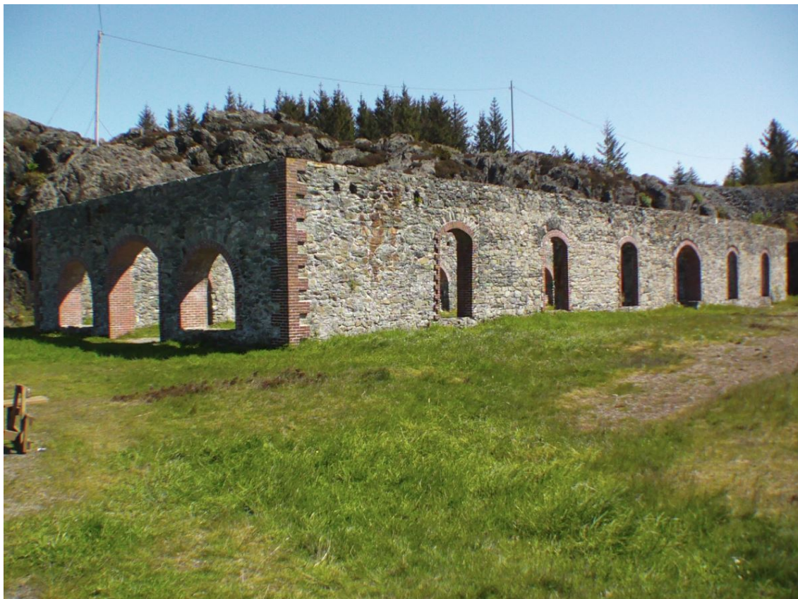
Ruin etter smeltehytta på Visnes, 02.03.2007 20:06