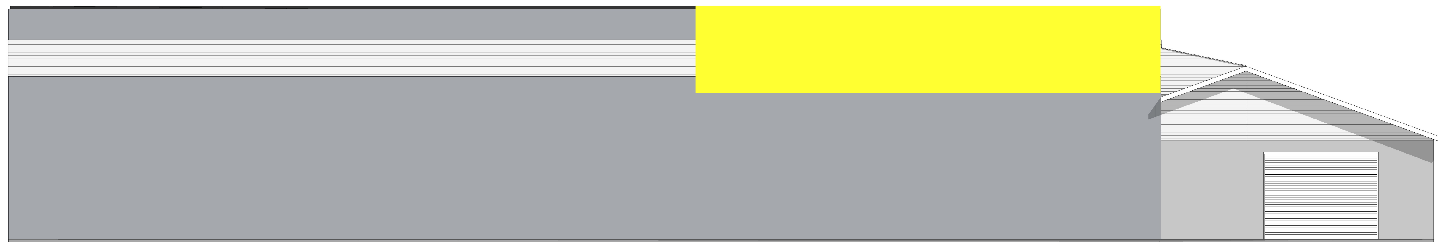
1:100 Fasade Nord/Vest