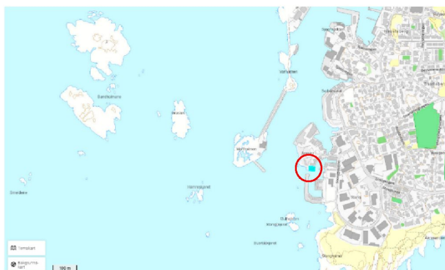
Figur 1. Oversikt over tiltaksområdet (rød sirkel).

Ved eiendom med Gnr./Bnr. 15/2062 Åkrehamn i Karmøy kommune ønsker tiltakshaver at eksisterende kai sikres og stabiliseres. Kaien har setningsskader og må stabiliseres og sikres mot ytterligere setningsskader. Dette da det planlegges for oppføring av ny enebolig som skal bygges delvis opp på kaien. Det søkes i forbindelse med dette om tillatelse etter forurensningsloven til tiltak i sjø. En oversikt over tiltaksområdet er vist i figur 1 2 .