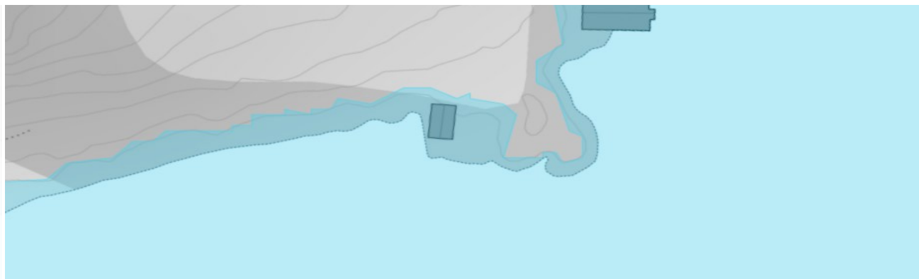
20 års stormsflo