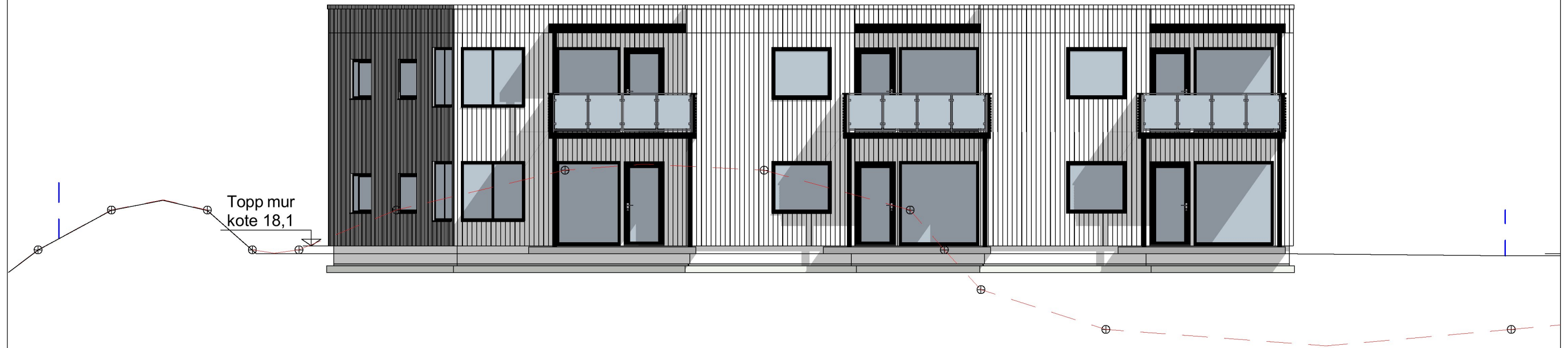
1:100 Fasade Vest