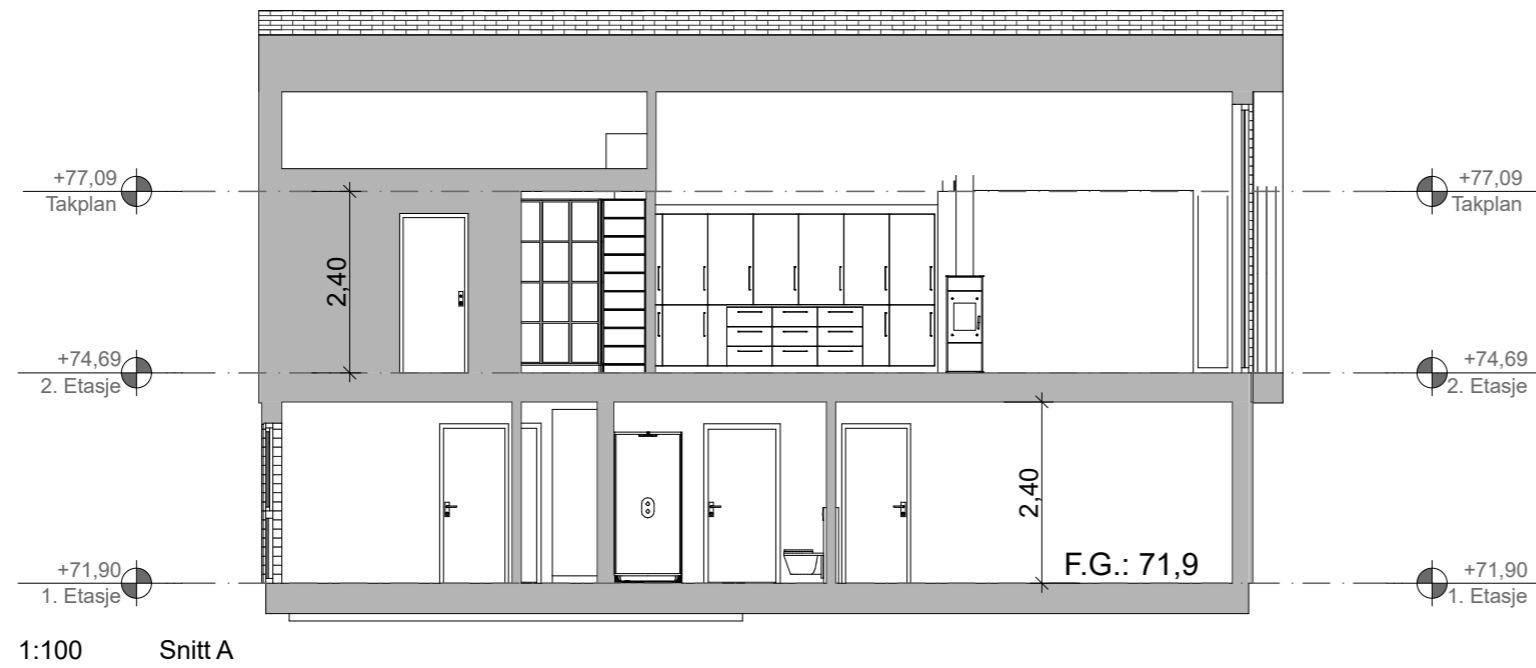
1:100 Snitt A