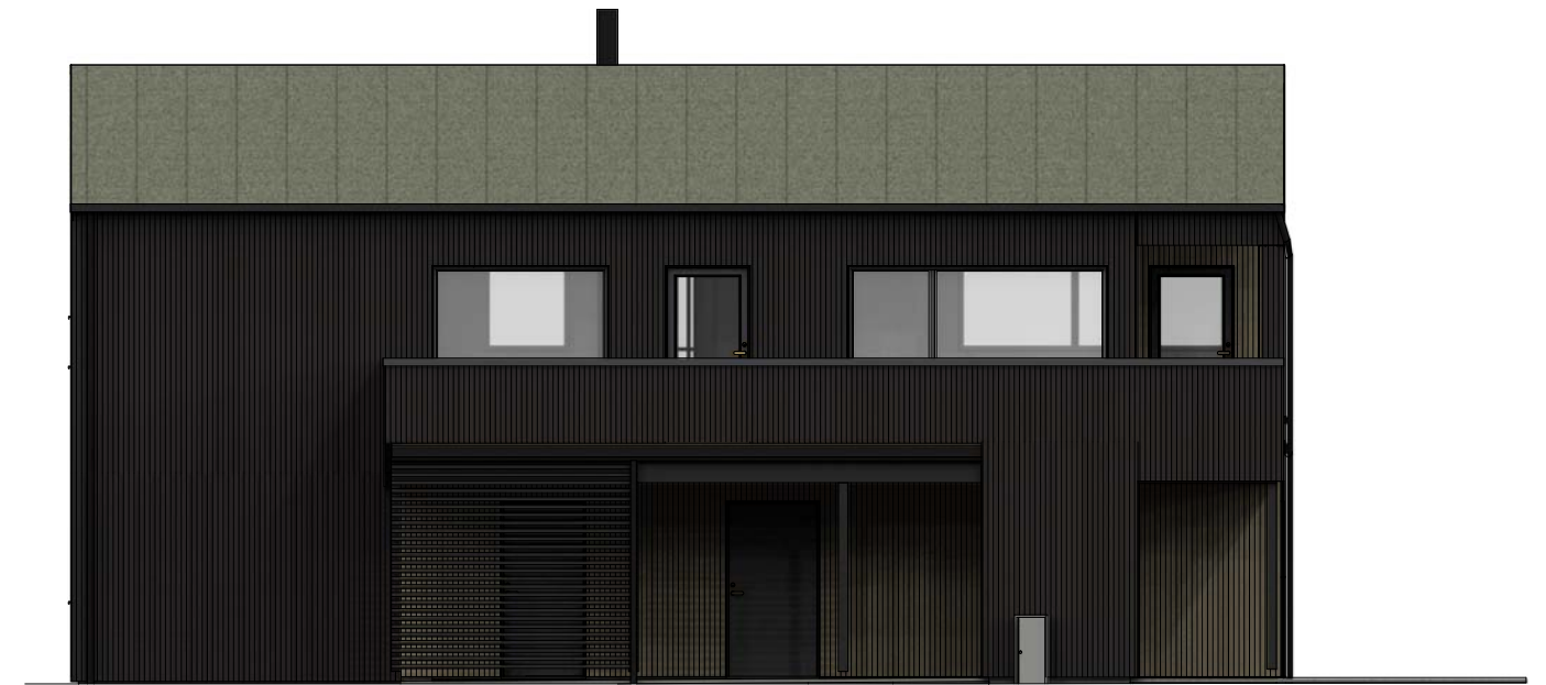
Fasade mot vest