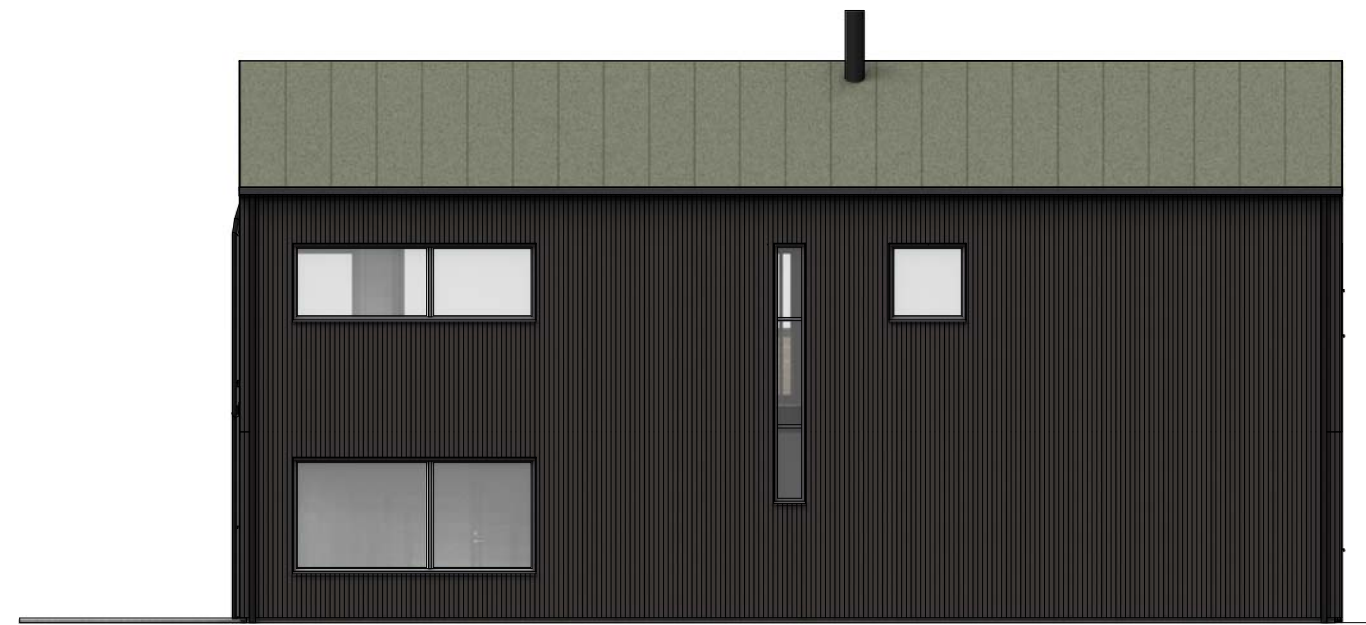
Fasade mot øst