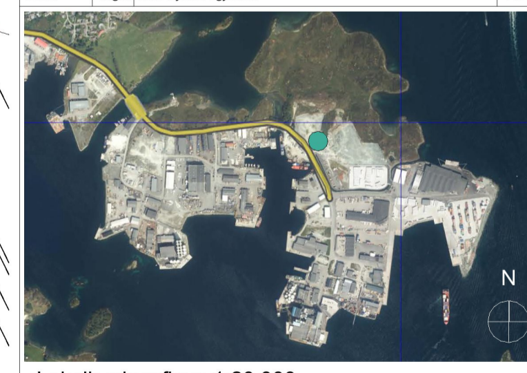
Lokaliseringsfigur 1:20 000

Oppdragsgiver / Prosjekt Consto Midt-Norge AS Åkra sjømat Karmsund Innhold Utomhusplan