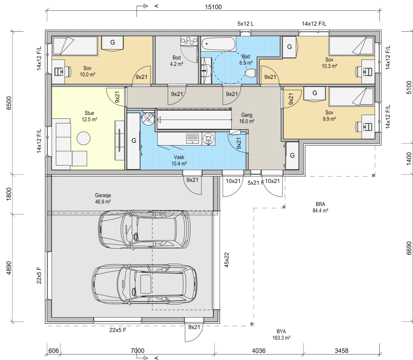
Plan 1 etg