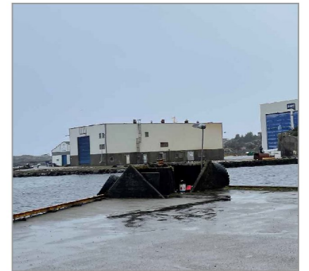
Dagens situasjon sørvest, betong konstruksjon