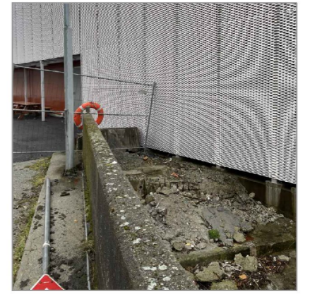
Dagens situasjon sørøst, ved Fryseriet