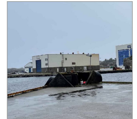
Dagens situasjon sørvest, betong konstruksjon