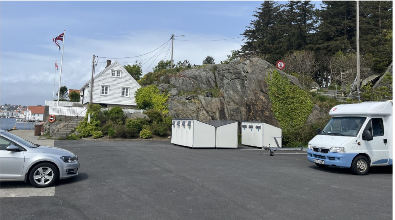
Lokasjon C- kaien