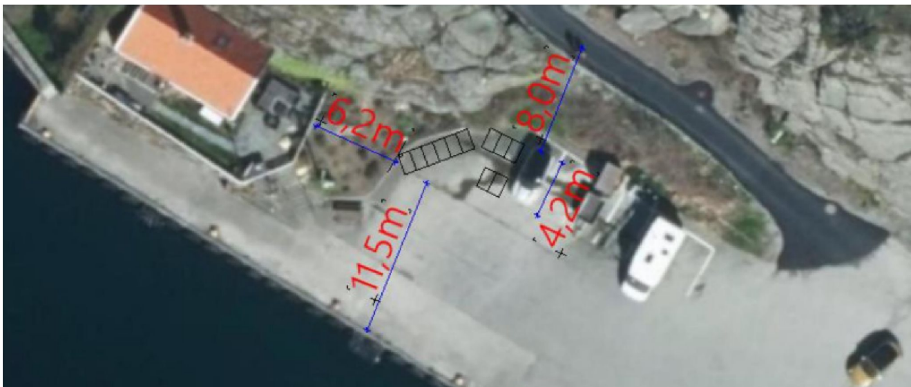
Luftfoto med plassering inntegnet

I strandsonen skal det etter pb1 § 1-8 første ledd tas særlig hensyn til natur- og kulturmiljø, friluftsliv, landskap og andre allmenne interesser. Disse hensynene skal ikke bli skadelidende om dispensasjon gis. Omsøkte tiltak er en felles avfallsstasjon. Tiltaket plasseres på det som i dag er «kaiareal» - i praksis parkering, og plasseres helt inntil hjørne mot terreng se luftfoto og bilde under, hensynene bak bestemmelsene eller lovens formålsbestemmelse anses ikke vesentlig tilsidesatt.