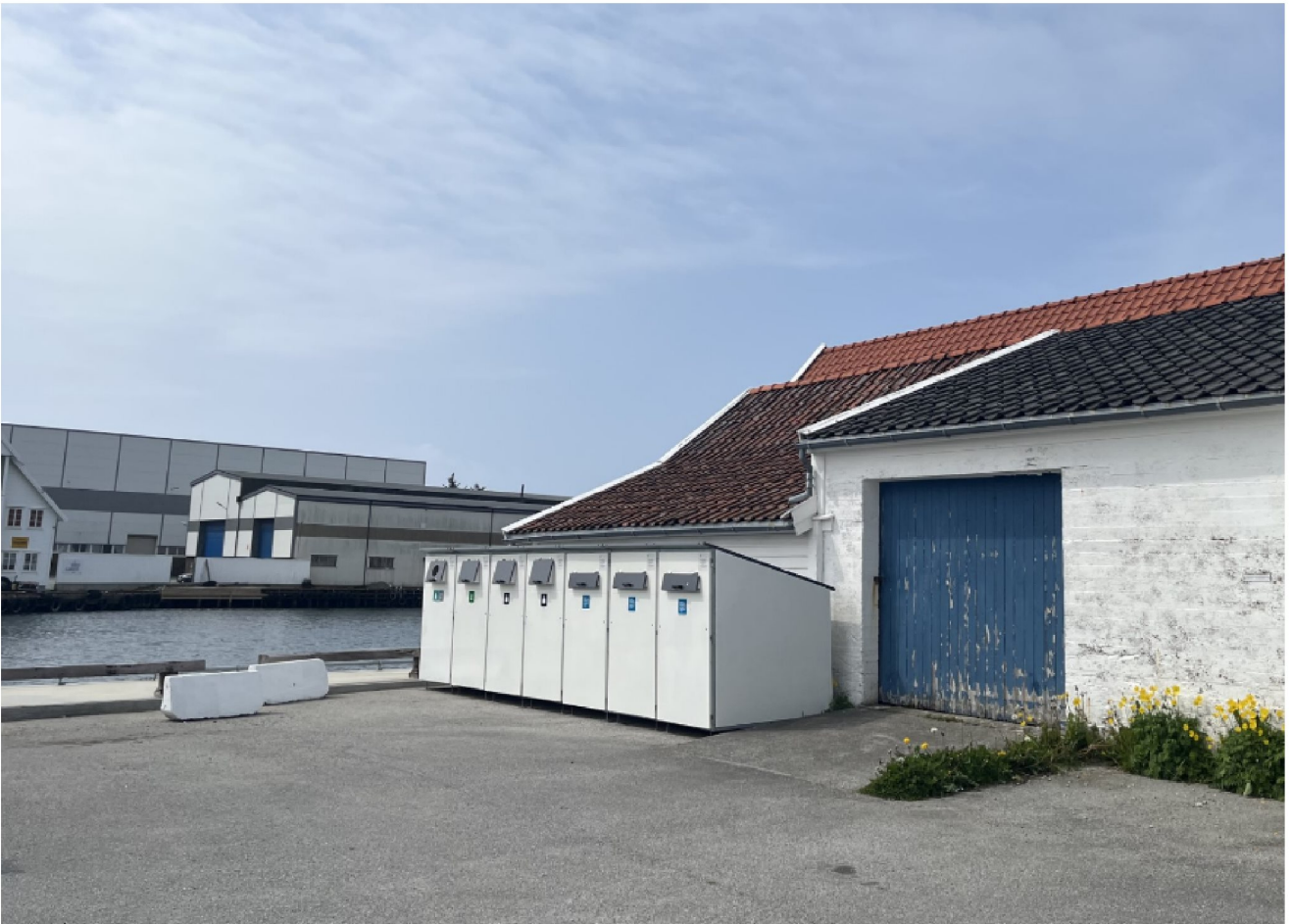
Lokasjon D- Anderson bryggen