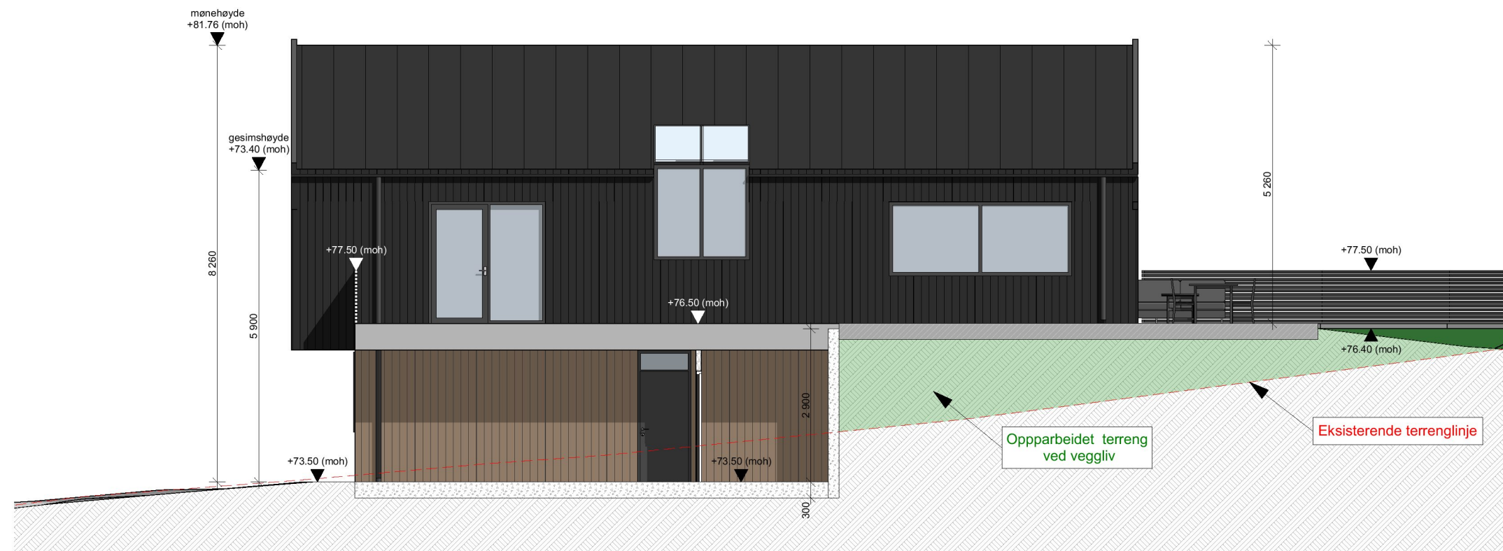
1:100 Fasade Vest