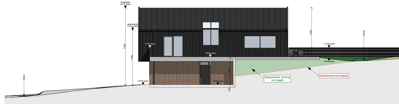
1:200 Fasade Vest