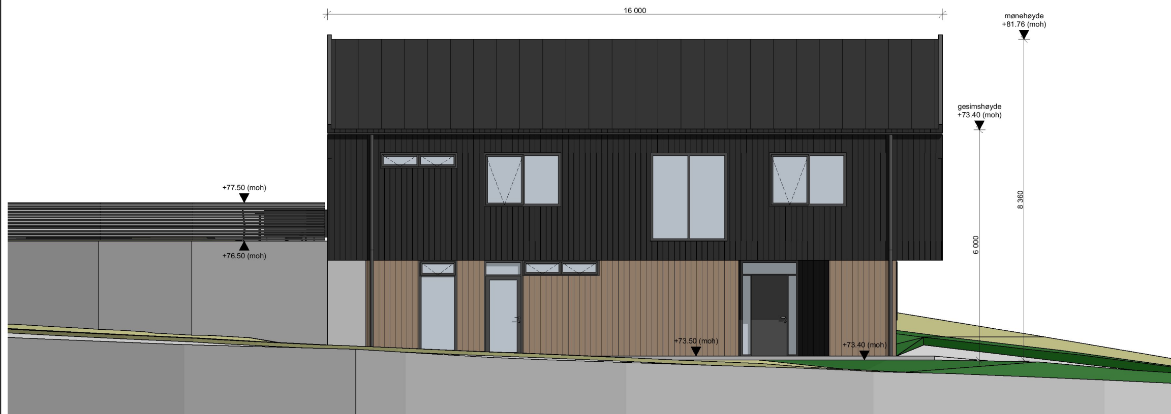
1:100 Fasade Øst