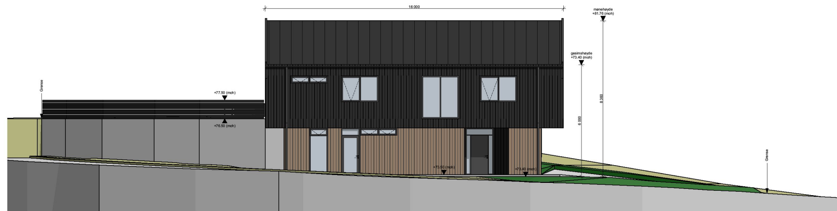
1:200 Fasade Øst