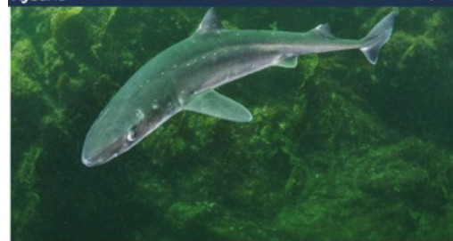
Riktig er begynt å bli et stadig større problem for havbruksnæringen.

Kyst.no KONTAKT OSS STILLINGER LOGG INN KALENDER