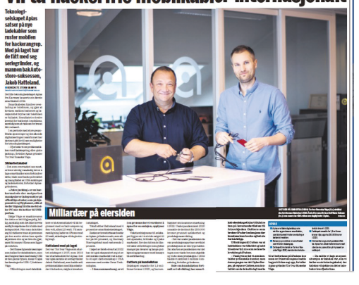
Milliardær på eiersiden