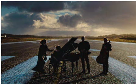
Munorensemblet, fotografering på Haugesund Lufthavn, Karmøy

Munor er aktiv på sosiale medier og kommer ut med 2 programhefter hvert år.