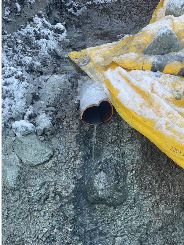
SI 0,00m Fra rør i grøft mot vestre karmøyveg 215C