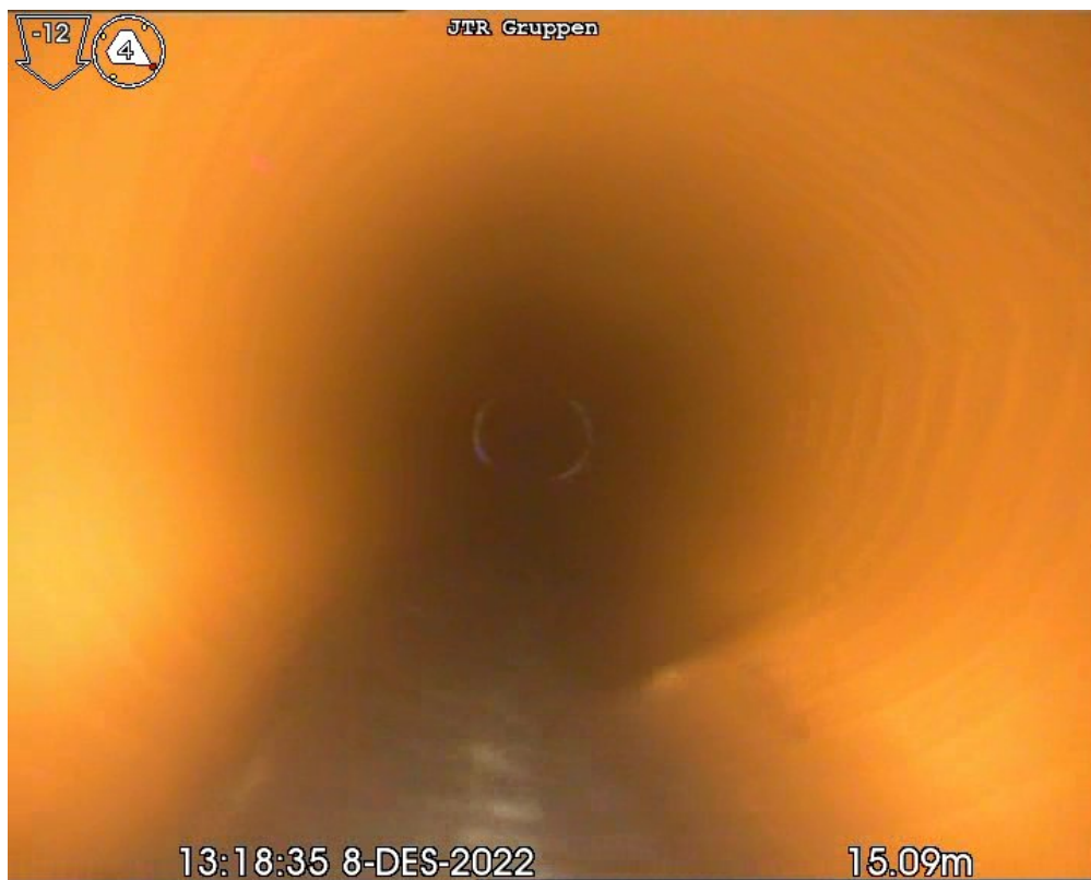
DF 15,10m Deformasjon, Gradering 1, Type: Punkt, Kl 5