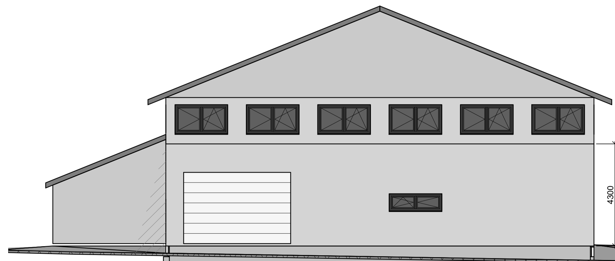
Fasade mot Vest 1 : 100