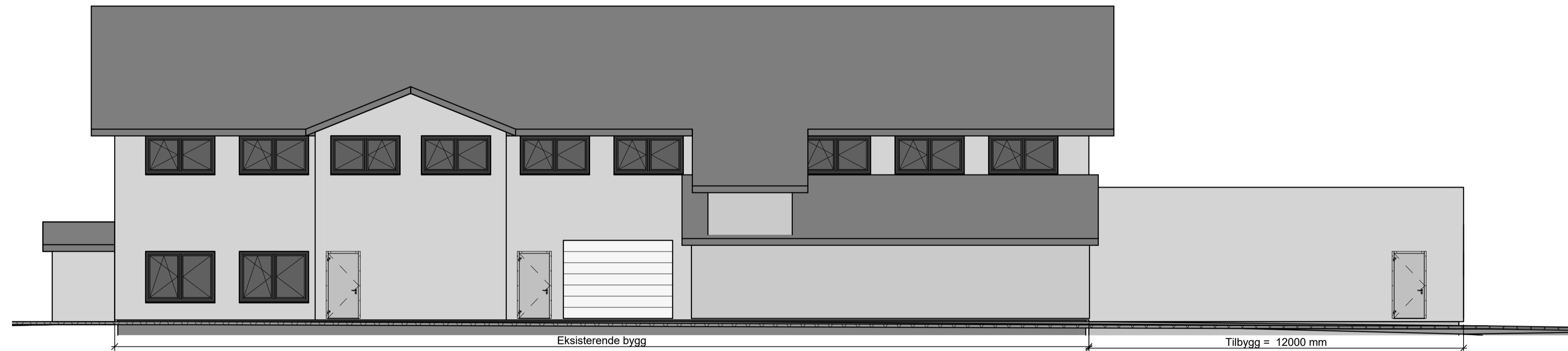
Fasade mot Nord 1 : 100