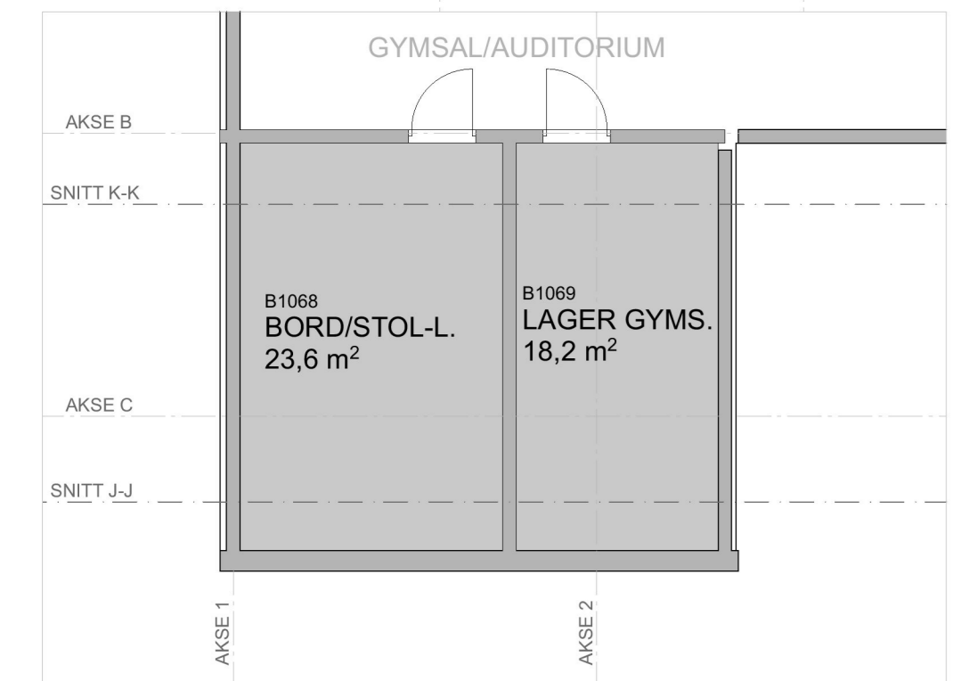
UTSNITT A - UNDER MEZZANIN (TRIMROM)