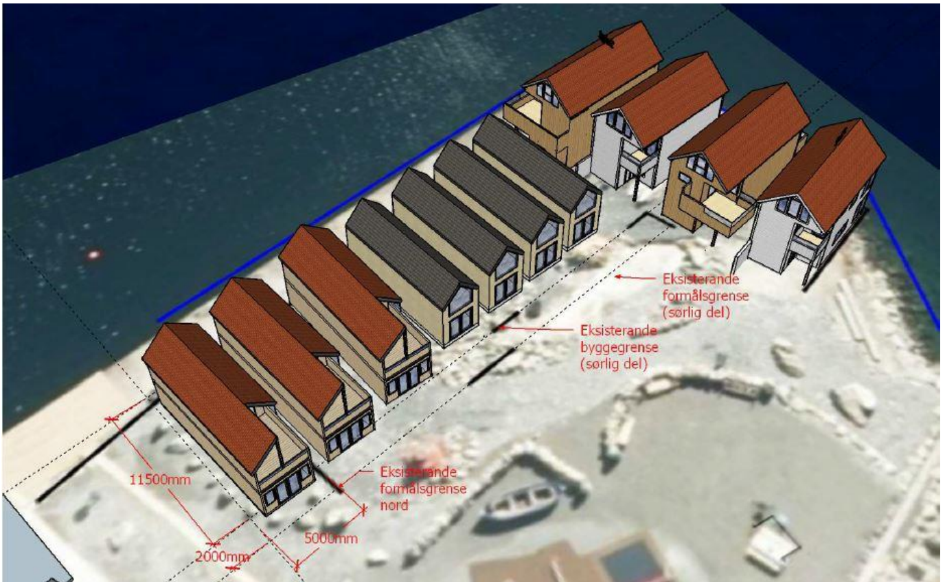
Fig. 3: Illustrasjon av planlagt utbygging av formålene FB3 og FB4 med frittliggende fritidsbebyggelse. To av de fire bygningene øverst til høyre er allerede bygt.

Planforslaget er vurdert til ikke å utløse krav om konsekvensutredning med planprogram i samsvar med PBL § 4-1 og 12-9. Endringen ville kunne gjennomføres som en mindre endring, i samsvar med referat fra oppstartsmøtet den 03.03.2023.