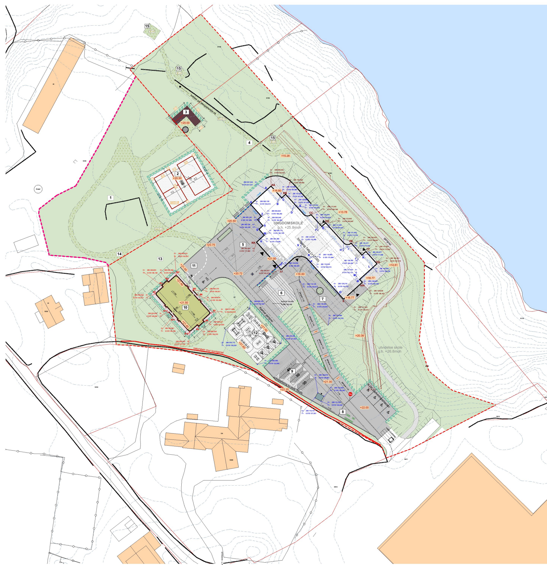
Kartunderlag bygges byggetrinn 1