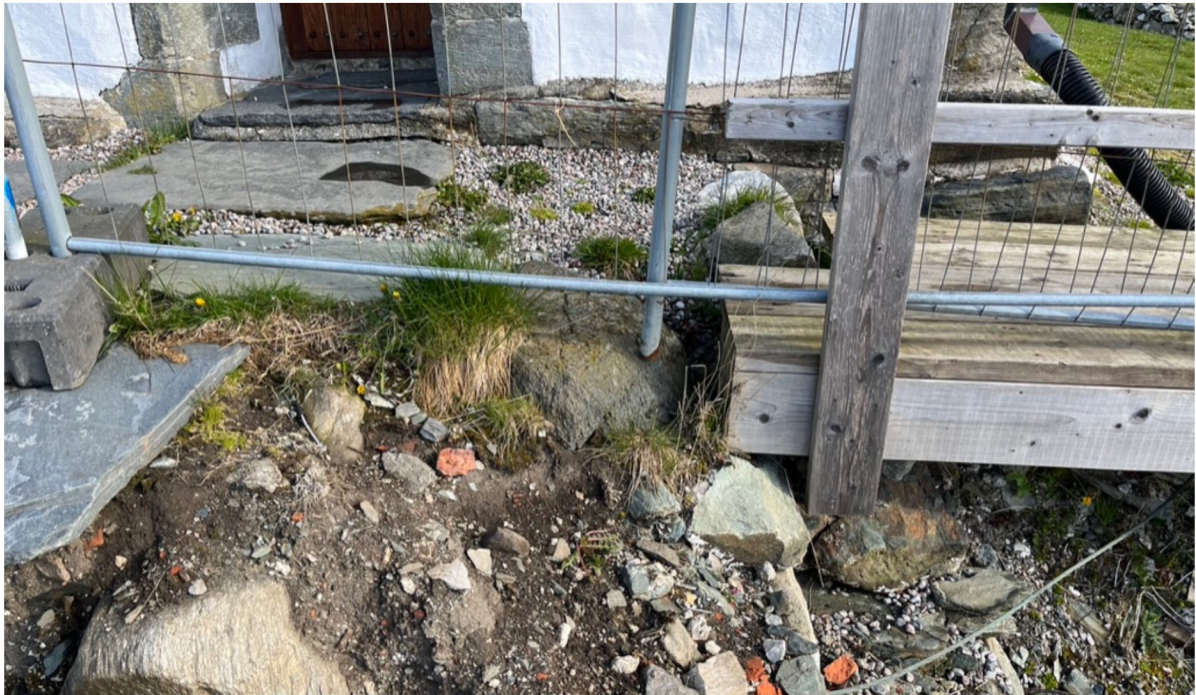
Over: Trekonstruksjon som hviler på forbindelsesmur.

Under: Rød markering viser hvor det etableres ny passasje og god flate ut fra korportal der helle legges tilsvarende eksisterende. Blå markering viser hvor overflate og noe av sidevanger på forbindelsesmur vil fremstå synlig.