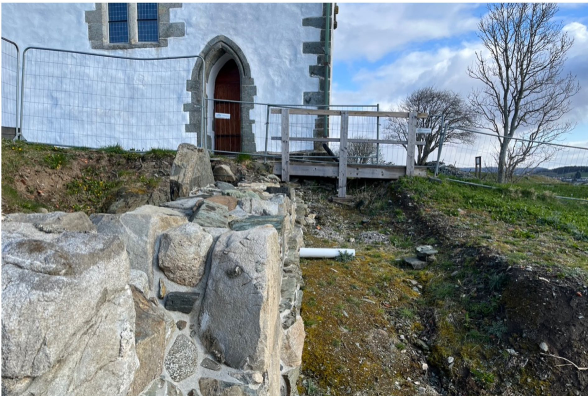
Over: Forbindelsesmur sett fra sør mot nord hvor forbindelsesmur møter korets sørvegg.

Når tiltaket er gjennomført vil murkronen synes i terrenget og ligge på samme nivå som dagens terreng rundt kirken. Utenfor korets søndre portal kan det deretter etableres et samlet nivå, 2-3 meter ut fra korets sørvegg.