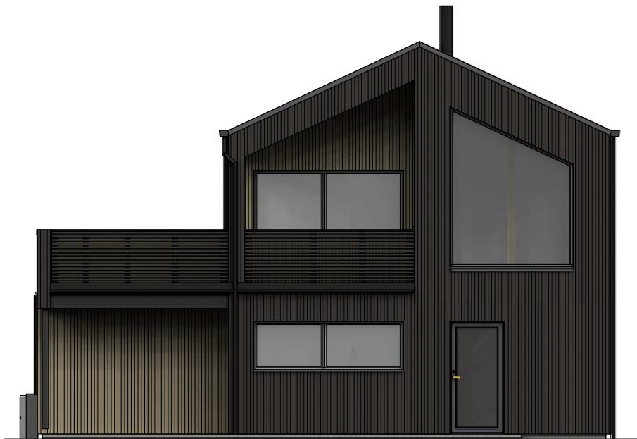
Fasade mot sør